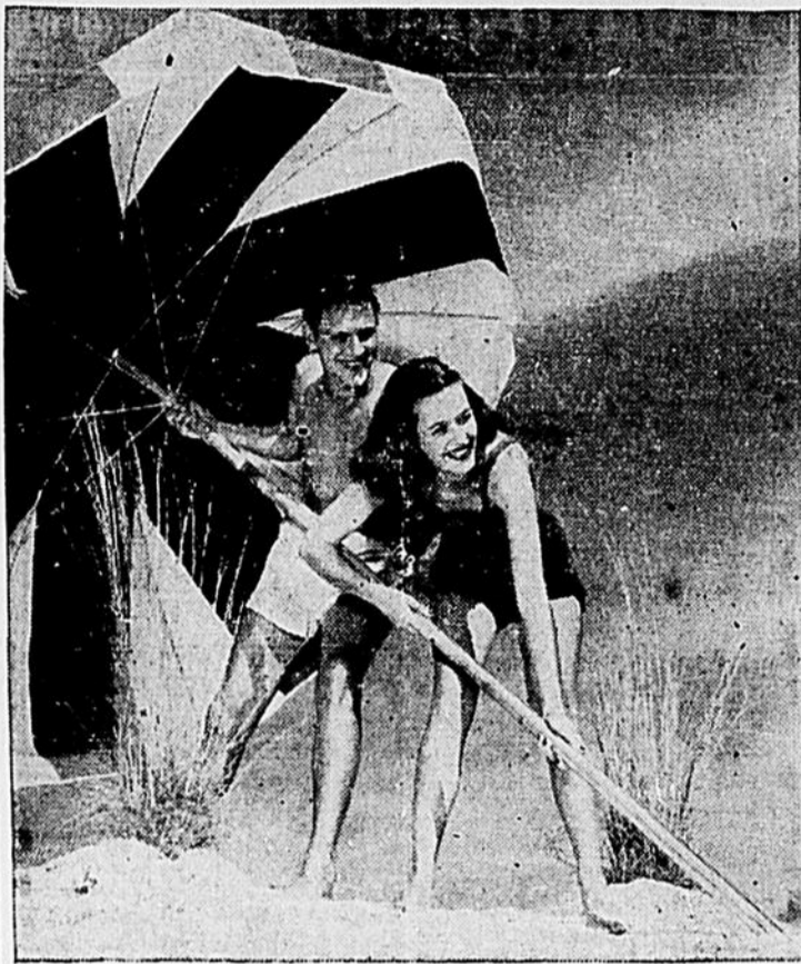
Une excellente photo en blanc et noir qui aurait pris un nouvel air si elle avait été en couleurs.