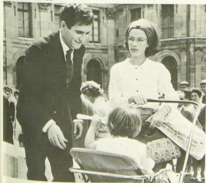
Le Journal d'un fou