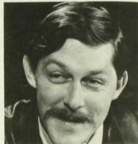
Pierre Olivier rencontre un participant ou un témoin d'un événement marquant de la semaine. Réal.: Claude-H. Roy.