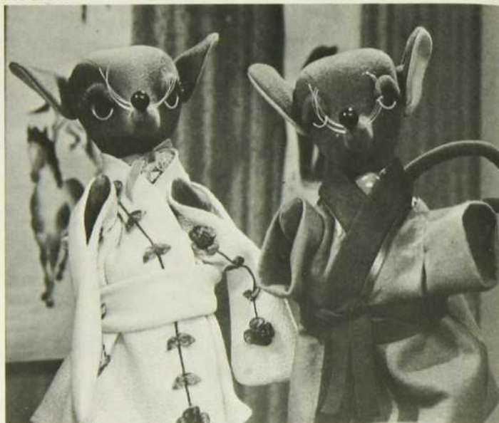
Nic et Pic