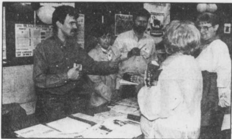
Plus de 27 000 visiteurs de tous les âges sont passés en fin de semaine au Salon des aînés de Québec.

Cette journée de la famille a aussi été soulignée par la présence de 26 associations de familles souches québécoises, dont les stands étaient éparpillés dans le pavillon de la jeunesse. Les Perron, Lambert, Ouellette, Robitaille, Veilleux, Gagnon et compagnie ont répondu aux questions de leurs « parents » sur leurs ancêtres, ils leur ont permis de feuilleter le dictionnaire généalogique et les ont guidés dans la préparation