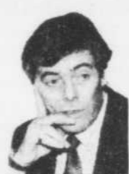
La chronique de Michel VASTEL

Pour les futurs gouvernements autochtones, ce droit s'étend, «sans pour autant s'y limiter, à la culture, à la langue, à l'enseignement, à la santé, au développement social, aux ressources naturelles». On va même jus-