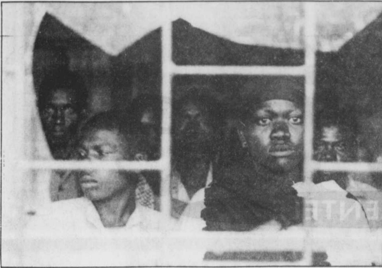
Des membres de la milice Interahamwe, accusés de tueries de masse, regardent par la fenêtre d'un immeuble qui tient lieu de prison et que dirigent les rebelles tutsis, à Musha, à une trentaine de kilomètres de la capitale rwandaise.