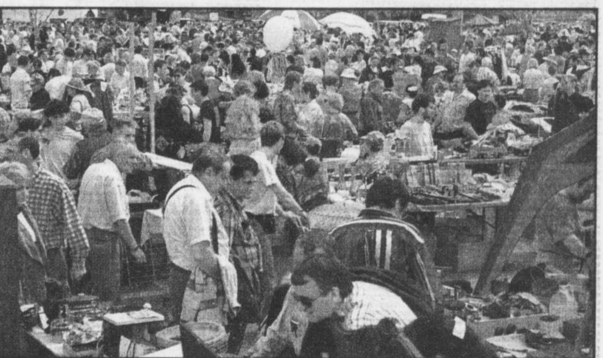
Taxe ou pas taxe, le marché aux puces de Sainte-Foy était bondé, hier.

« Le jour où ils font ça (obliger à taxer les clients) nous on dé-