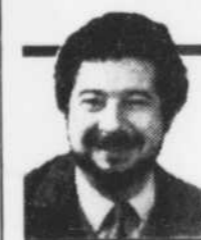
par Raymond GIROUX

Rwanda, Bosnie, Slovaquie, Haïti, et encore: pays baltes, Cuba, Ukraine et ainsi de suite. Qu'ont donc ces pays en commun? Une diaspora, une émigration libre ou forcée qui influence le cours des événements à partir de l'étranger.