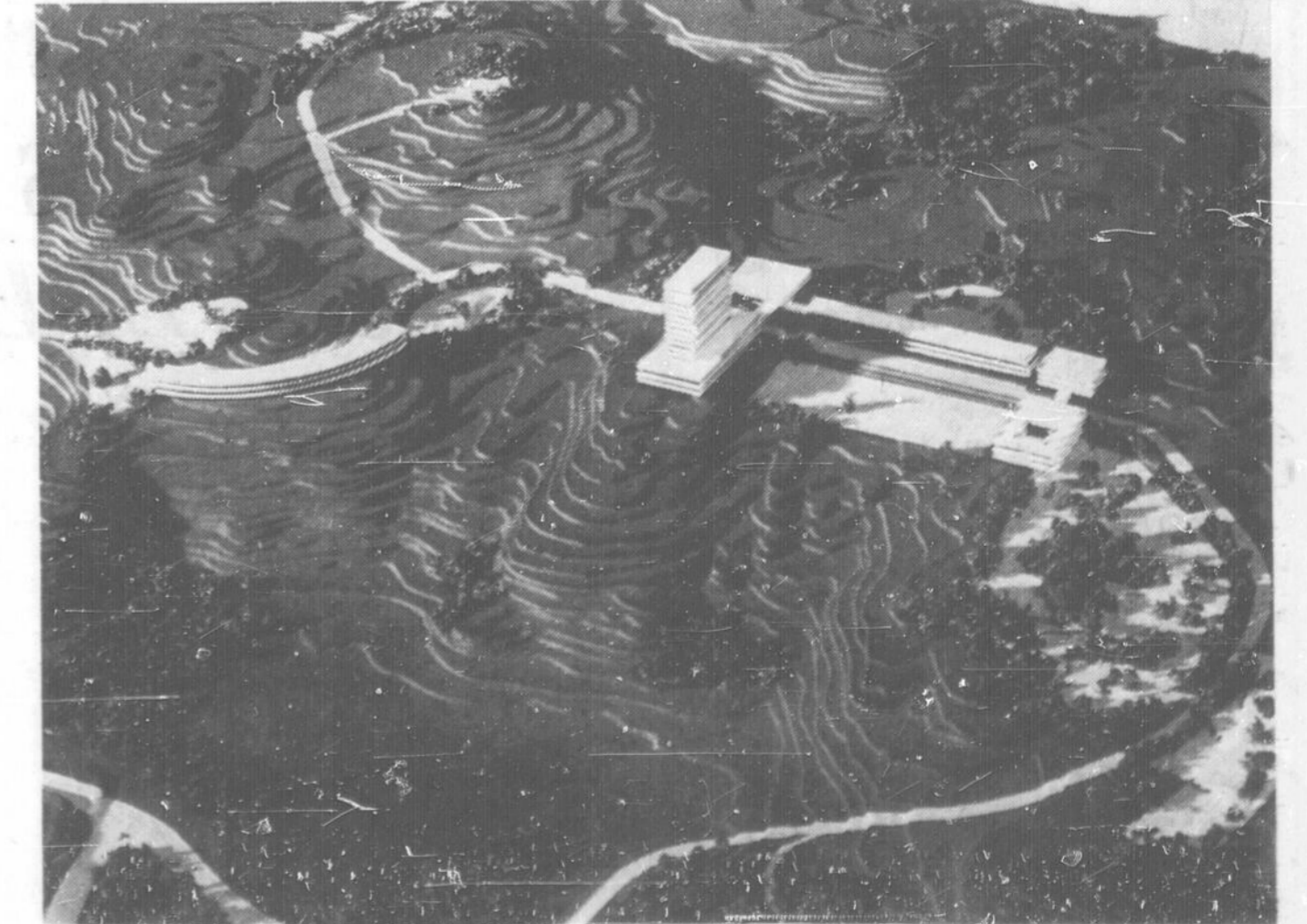
DU HAUT DES AIRS — Une vue à vol d'oiseau de la future université Laurentienne de Sudbury. Les 550 acres de la future cité universitaire sont limités par les lacs Ramsey, Trout et Pike et par le terrain de golf Idylwyld et la route South Bay.