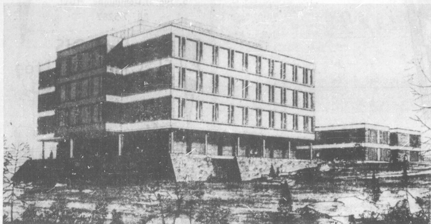
L'EDIFICE DES SCIENCES — Les architectes David, Barrott et Boulva, de Montréal, ont conçu et tracé les plans de l'édifice des sciences qui s'élèvera sur l'emplacement de la future

université Laurentienne, à Sudbury. La construction de cet édifice ainsi que plusieurs autres doit commencer dès le printemps prochain pour être complétée avant septembre 1964.