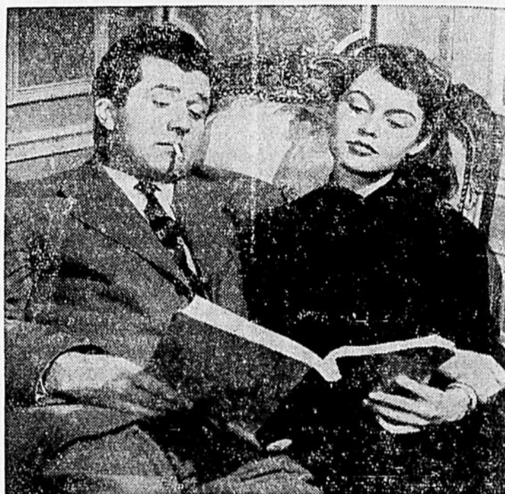
Jean Richard et Brigitte Bardot, dans une scène du film "Le Portrait de son Père" qui prendra l'affiche dès samedi, au Cinéma de Paris. Au même programme: "Je suis un Mouchard", avec Paul Meurisse et Madeleine Robinson.