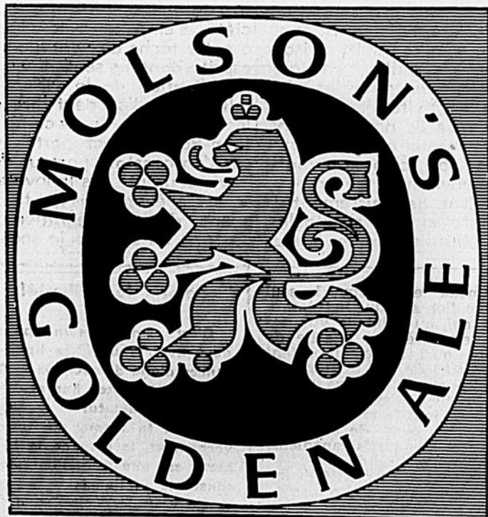
MOLSON'S GOLDEN ALE BREWERY LIMITED