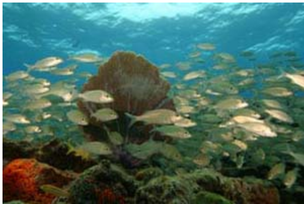
Images du film Sous les mers du monde en 3D

Les gens du cinéma Imax du Centre des sciences de Montréal ont inscrit