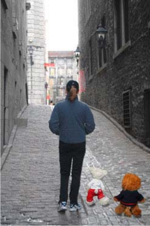
mademoiselle X et ses deux mascottes: ourson athlète et monsieur x sur les quais du Vieux-Port de Montréal «La vision, c'est de voir les choses invisibles...»