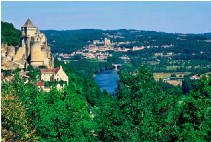
Vue de la région d'Aquitaine

L'industrie touristique de la France est très présente au Canada et en particulier au Québec. L'une des raisons est le travail constant de sensibilisation qu'effectue la Maison de la France à Montréal. Les responsables français organisent de façon régulière des rencontres entre la presse canadienne et les représentants de régions françaises. La toute récente présentation était pour l'Aquitaine. Un territoire qui est reconnu pour ses stations touristiques et surtout ses vins tels que les Bordeaux, Yquem, Margaux et d'autres. Plusieurs Canadiens