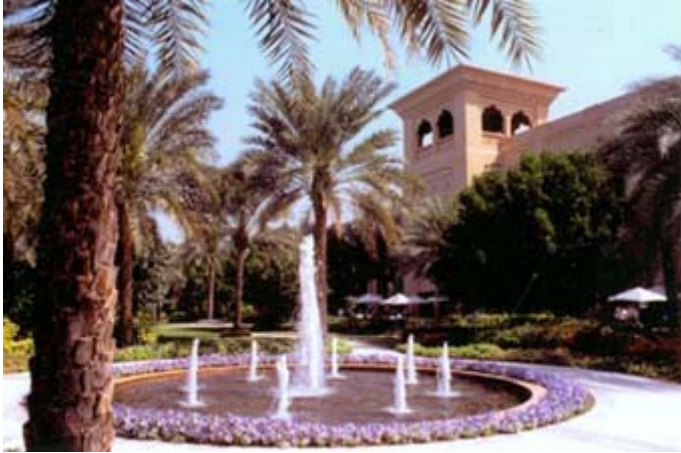
One & Only Royal Mirage Dubai

Le collaborateur Jacques Robert nous présente la suite de son reportage sur les grands hôtels de Dubai. Il nous offre cette semaine en photo une visite du fameux «One & Only Royal Mirage». Un endroit considéré comme l'un des plus représentatifs du raffinement et des couleurs de la culture arabe. Le complexe comprend un hôtel, un terrain de golf et un centre Spa. On dit même que Richard Branson fréquente l'endroit... www.LeStudio1.com/MirageDubai