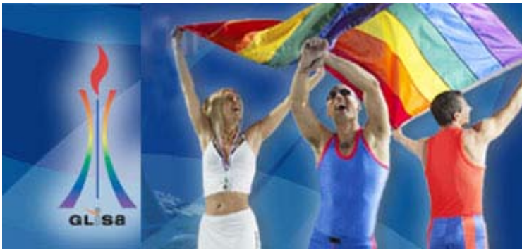
Outgames Montréal 2006

Le comité organisateur des Outgames de Montréal est de plus en plus présent, notamment sur l'Internet. On peut déjà se procurer des billets pour les cérémonies ainsi que certains objets souvenirs. Cet événement sportif d'envergure mondiale devrait apporter à Montréal des retombées importantes durant la prochaine saison estivale, un peu comme l'avait fait l'an dernier la compétition de natation FINA. Les 1er Outgames mondiaux se dérouleront du 26 juillet au 5 août prochain.