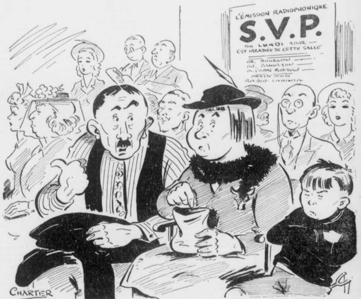
"Y paraît que ça peut aider ben gros not' p'tit Paul pour le QUESTIONNAIRE DE LA JEUNESSE!"