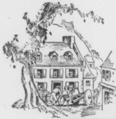
C'est dans un but de tempérance que Jean Talon fondait à Québec, en 1668, la première brasserie du Canada.