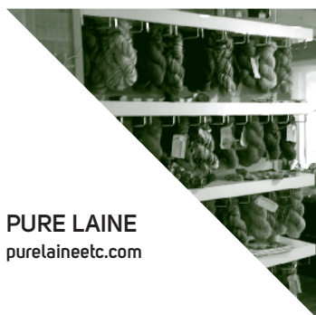
PURE LAINE purelaineetc.com

Spécialisée dans la fabrication sur place de pâtes fraîches et de succulentes sauces, la boutique-restaurant est située sur la rue St-Jovite à Mont-Tremblant.