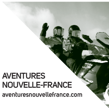
AVENTURES NOUVELLE-FRANCE aventuresnouvellefrance.com

Spécialisés dans les séjours multi activités et raid en motoneige ainsi que dans les séjours multi activités été et Golf au Canada pour les touristes européens.