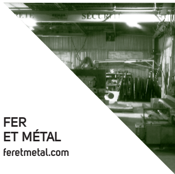
FER ET MÉTAL feretmetal.com

Spécialisés dans les séjours multi activités et raid en motoneige ainsi que dans les séjours multi activités été et Golf au Canada pour les touristes européens.