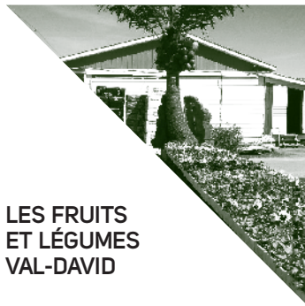
LES FRUITS ET LÉGUMES VAL-DAVID

Spécialiste dans la fabrication de ponceaux, distributeur de métaux et d'acier. Œuvre aussi dans la transformation de pièces métalliques de toutes sortes.