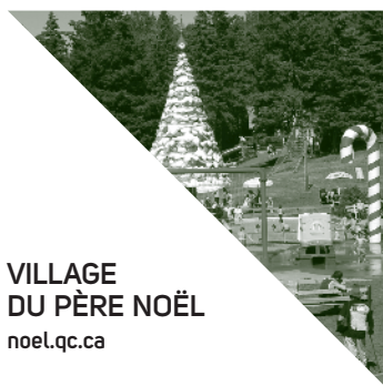
VILLAGE DU PÈRE NOËL noel.qc.ca

Organisme à but non lucratif fournissant les services de télévision depuis 1991 et Internet depuis 2007 dans le noyau villageois de La Conception.