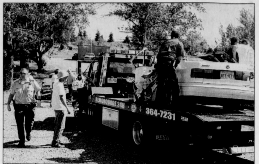
COLLABORATION SPÉCIALE, GILLES GAGNÉ

Dans le but de favoriser l'achalandage et de stimuler l'activité touristique au centre-ville, le conseil municipal de Rivière-du-Loup a décidé d'autoriser l'aménagement de terrasses sur une partie de l'emprise de rue de la municipalité. Pour exploiter un café-terrasse empiétant sur la propriété publique, le propriétaire devra franchir certaines étapes administratives avant d'obtenir un permis moyennant des frais de location de l'espace public. Les installations devront demeurer temporaires. Les permis émis pour ce genre de commerce seront autorisés entre le 1 er mai et 1 er octobre de chaque année. D'autre part, le conseil municipal a adopté un règlement interdisant les salles de jeux électroniques de type « arcades » sur son territoire. Les salles de billard, de quilles et les établissements détenteurs d'un permis émis par la Régie