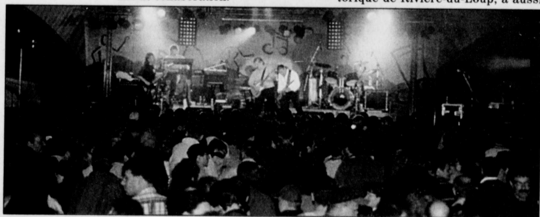
Plus de 3 500 personnes ont assisté au spectacle de Garolou.

Pour le duo « L'Autre temps », composé de Sylvie Belzile et de Réal Chouinard, c'était l'occasion d'offrir leur spectacle d'adieu après plus de 20 ans de collaboration.