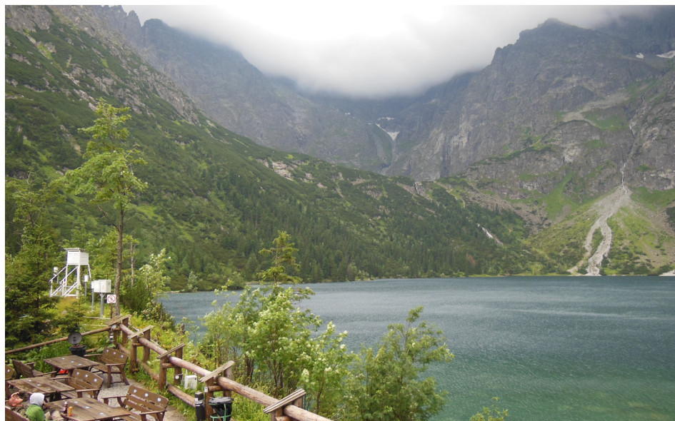
Le lac Morskie oko, en Pologne.

Finalement, je dois mentionner que les Polonais sont un peuple gentil, cultivé et agréable. Ils accordent une grande place aux arts dans leur société. Très religieuse, la population décore régulièrement la devanture de leur résidence avec des artefacts religieux (statues, croix ou autres). Les passants plus âgés font le signe de croix devant chaque résidence ainsi décorée. Fait à noter, peu de gens parlent de l'époque communiste, cette période est presque taboue. La nouvelle classe moyenne, plus instruite et plus riche, délaisse la traditionnelle vodka et brasse ses bières. Les Polonais apprennent l'anglais ou le français et voyagent de plus en plus. C'est un pays qui a beaucoup à offrir.