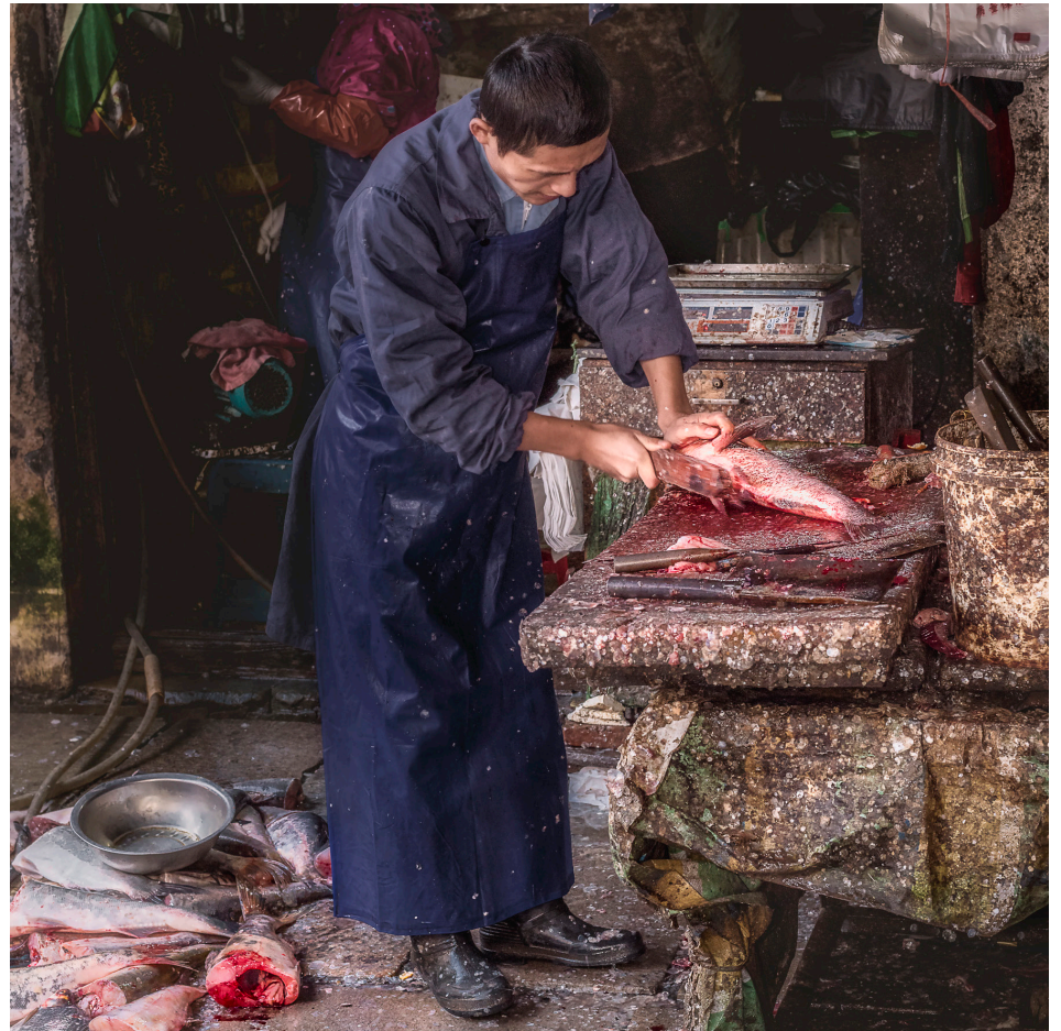
Un des marchands de poissons au marché FengMen. Pour beaucoup de gens qui regardent ce kiosque, les poissons sont dispersés sur le sol parmi les écailles de poisson et les abats. Mais un flux constant de clients vient acheter un poisson «frais» pour le dîner.