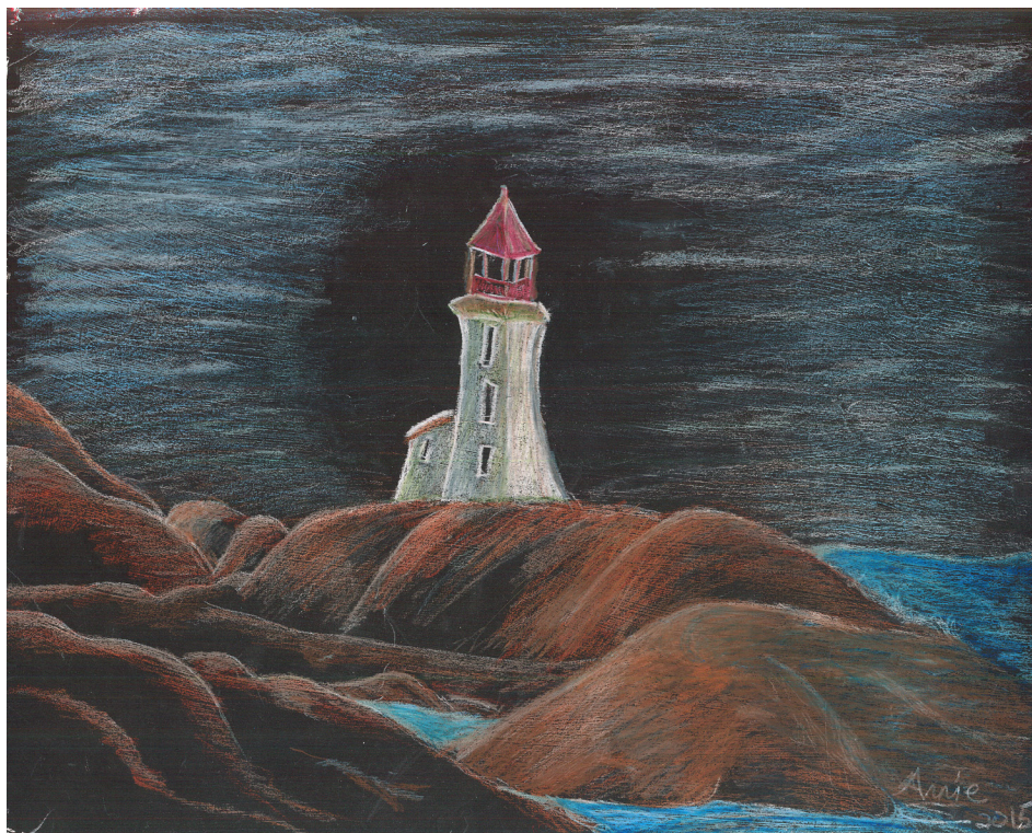
Phare, d'Annie Laberge acrylique crayon de couleur 11x14 : une oeuvre réalisée dans le cadre de l'atelier L'Art de la rue.

Des artistes professionnels se joignent à la cause du Journal de rue. L'exposition au Parvis permettra aux artistes de l'atelier d'être en contact avec des artistes professionnels : leurs œuvres seront placées aux côtés de