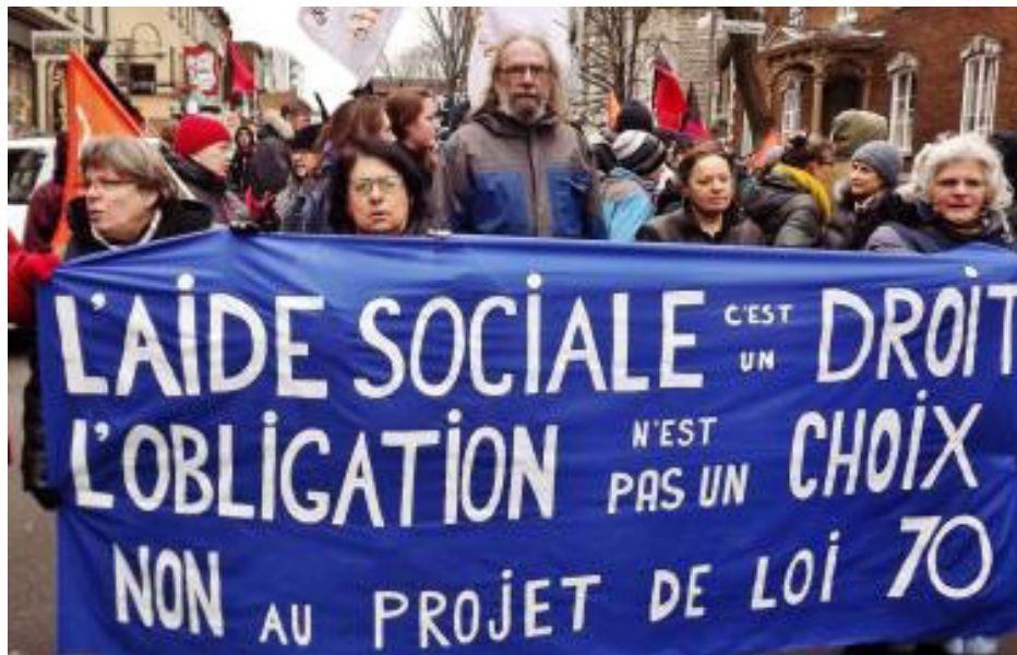
Un groupe militant pour la défense des droits des personnes assistées sociales lors du manifestation à Québec en janvier 2016.

Chaque année, environ 17 000 personnes déposent une première demande d'aide sociale. Parmi elles, une majorité