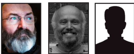
Marcel Morin Chroniqueur et photographe Jan-Léopold Munk Collaborateur VOTRE PLACE

LE JOURNAL DE RUE DE SHERBROOKE recherche des collaborateurs JOURNALISTES, PHOTOGRAPHES, RECHERCHISTES, BÉDÉISTES, GRAPHISTES