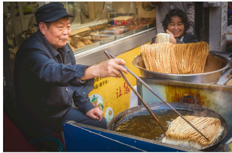
Vendeur de «San Zi» (pâte à pain roulée très fine et frite dans une huile bouillante).

Comme le village d'Astérix qui résistait toujours à la conquête romaine, le marché de la ruelle FengMen, à Suzhou en Chine, résiste toujours à la conquête d'une ville de plus en plus grande et ultramoderne. Cette petite ruelle est le dernier secteur qui garde toujours ce cachet authentique ancestral de la Chine d'autrefois.