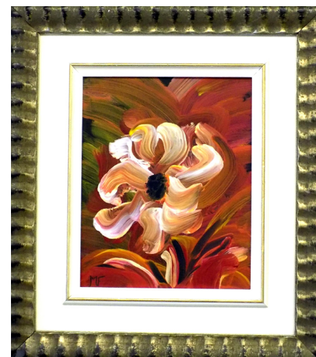
Peinture acrylique de Martine Faure