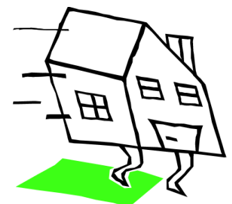
Table itinérance de Sherbrooke