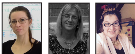
Nancy Mongeau Éditrice Sophie Boucher Collaboratrice rédaction Claudia Pâquet Chroniqueuse