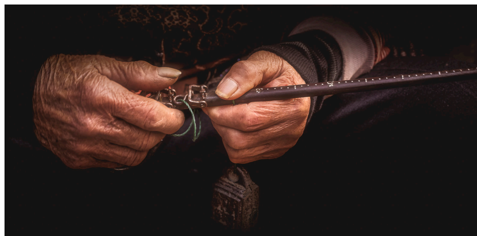
Petite balance à contre poids.

Vous pouvez me contacter: mars.was.here.photos@gmail.com Photos additionnelles: 500px.com/marswashere