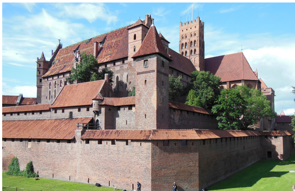
Le château de Malbork

Pour les amoureux de l'histoire, ce pays renferme de nombreux sites d'importance associés à la seconde guerre mondiale. On peut visiter ce qu'il reste de la tanière du loup, le QG d'Hitler. C'est là qu'il a failli trouver la mort suite à une tentative ratée de coup d'état (voir le film Walkyrie avec Tom Cruise). Évidemment, les quartiers juifs de Varsovie et Cracovie peuvent nous révéler des anecdotes concernant ces pauvres gens qui ont fini leurs jours à Auschwitz/Birkenau. Le plus réputé et le plus terrible des camps de la mort qui se situe à proximité de Cracovie. La visite de ce site est pratiquement un pèlerinage: en le parcourant on croit ressentir les âmes des malheureux y ayant fini leurs jours (plus de 1,1 millions de gens, dont environ 900 000 juifs). Dans