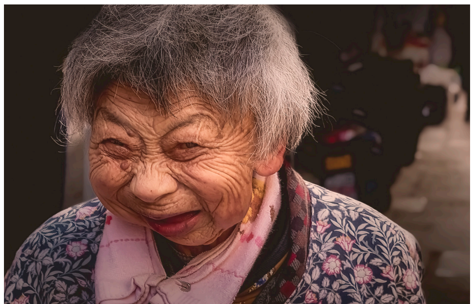
Cette vieille dame de 85 ans vit de ce qu'elle peut amasser sur la rue et des dons de nourriture des petits marchands. Elle me fait un grand sourire et malgré sa grande pauvreté elle fouille dans sa poche, en retire deux noix de Grenoble et me les offre.