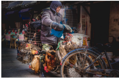
Livraison de poulets entassés sur une motocyclette.