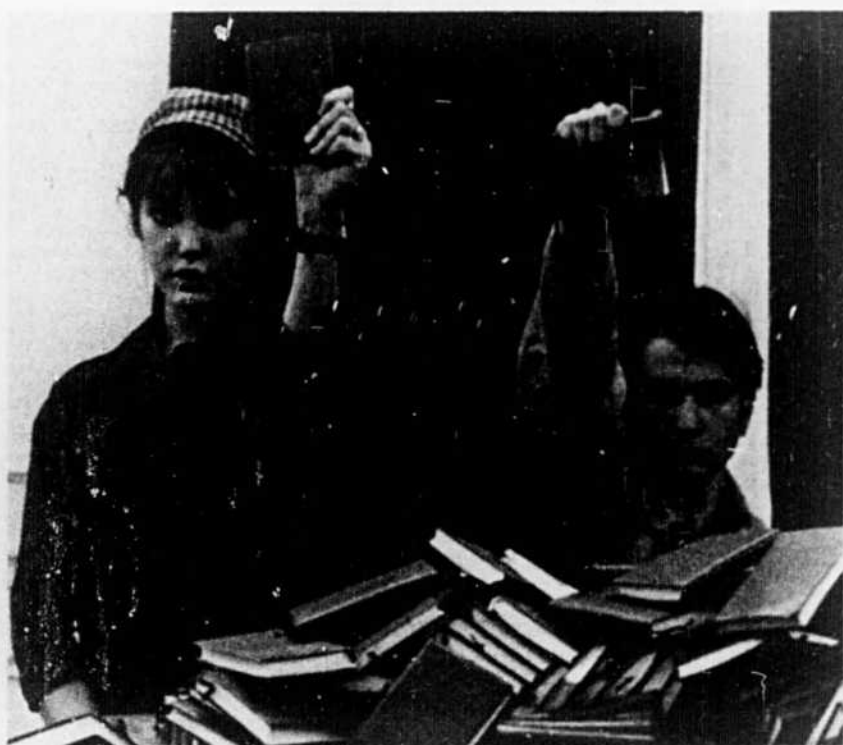
Anne Wiazemsky et Jean-Pierre Léaud dans "la Chinoise". (Radio-Canada, dimanche, 11:30 pm)