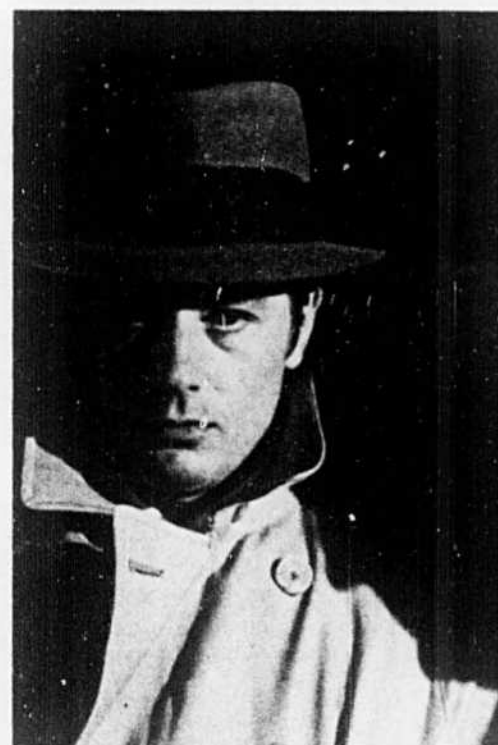
Alain Delon dans "le Samourai". (Radio-Canada, jeudi, 8:00 pm)