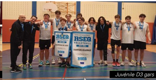
Juvénile D3 gars