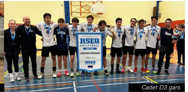
Cadet D3 gars