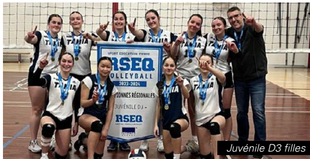
Juvénile D3 filles