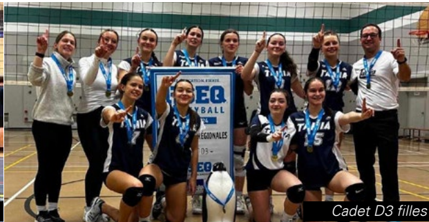
Cadet D3 filles