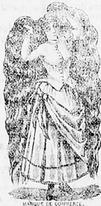
MARQUE DE COMMERCE.

Robson rend aux cheveux leur noir primitif, mais il possède de plus la précieuse propriété de les assouplir et de leur donner un lustre incomparable. Essayez ce Restaurateur, et vous serez pleinement satisfait. Prix 50 cts la bouteille. Vendu chez tous les marchands et chez L. ROBITAILLE, Pharm, Joliette.