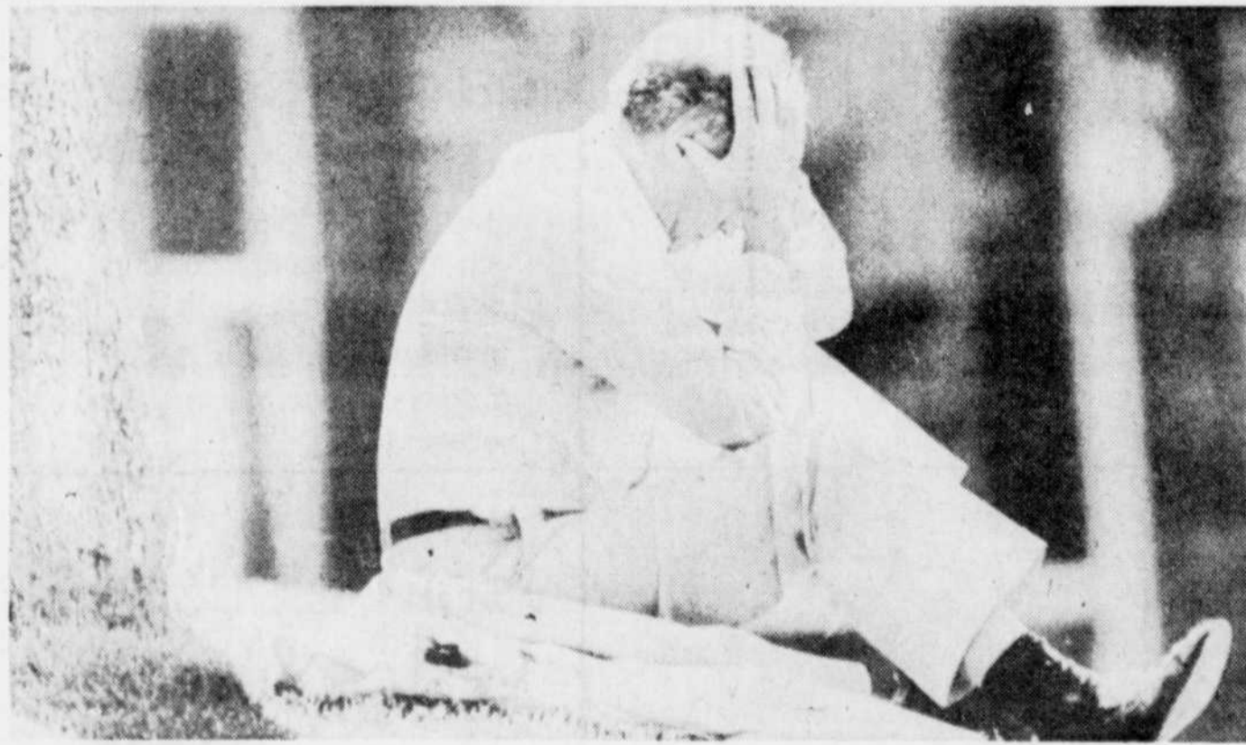
A Banff, samedi, M. Trudeau paraissait songeur.