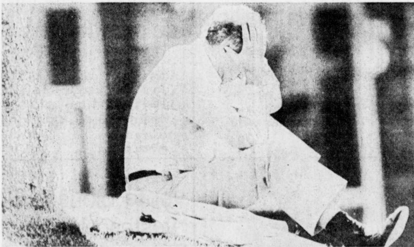
A Banff, samedi, M. Trudeau paraissait songeur.

Quant aux 1,800 résidents et internes en grève aussi depuis jeudi, le communiqué du MAS ne dit rien à leur sujet. Ces derniers ne sont pas en négociation. Ils protestent contre l'imposition d'un tarif inférieur pour les médecins débutants en territoires urbains.