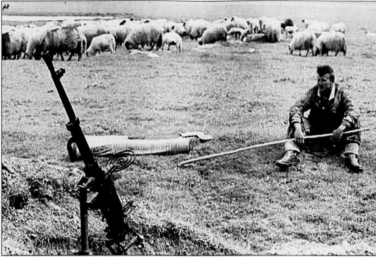
Ce berger croate de Novi Travnik, en Bosnie-Herzégovine observe une trêve prudente: un oeil sur ses brebis un autre sur la mitrailleuse au cas où...