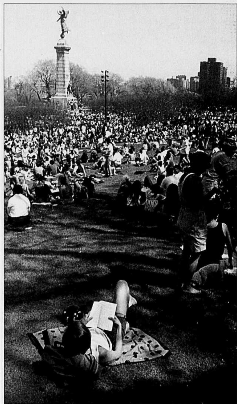
Il faisait vraiment trop beau pour travailler hier. Notre photographe a tout de même fait son devoir pour aller croquer au flanc du mont Royal cette scène de farniente, de lumière et de plaisir. Enfin l'été est revenu.

«Le discours flatter sur le caractère préuniversitaire de l'enseignement collégial se termine ainsi par la secondarisation évidente de ce niveau d'enseignement», a dit M. Lauzière.