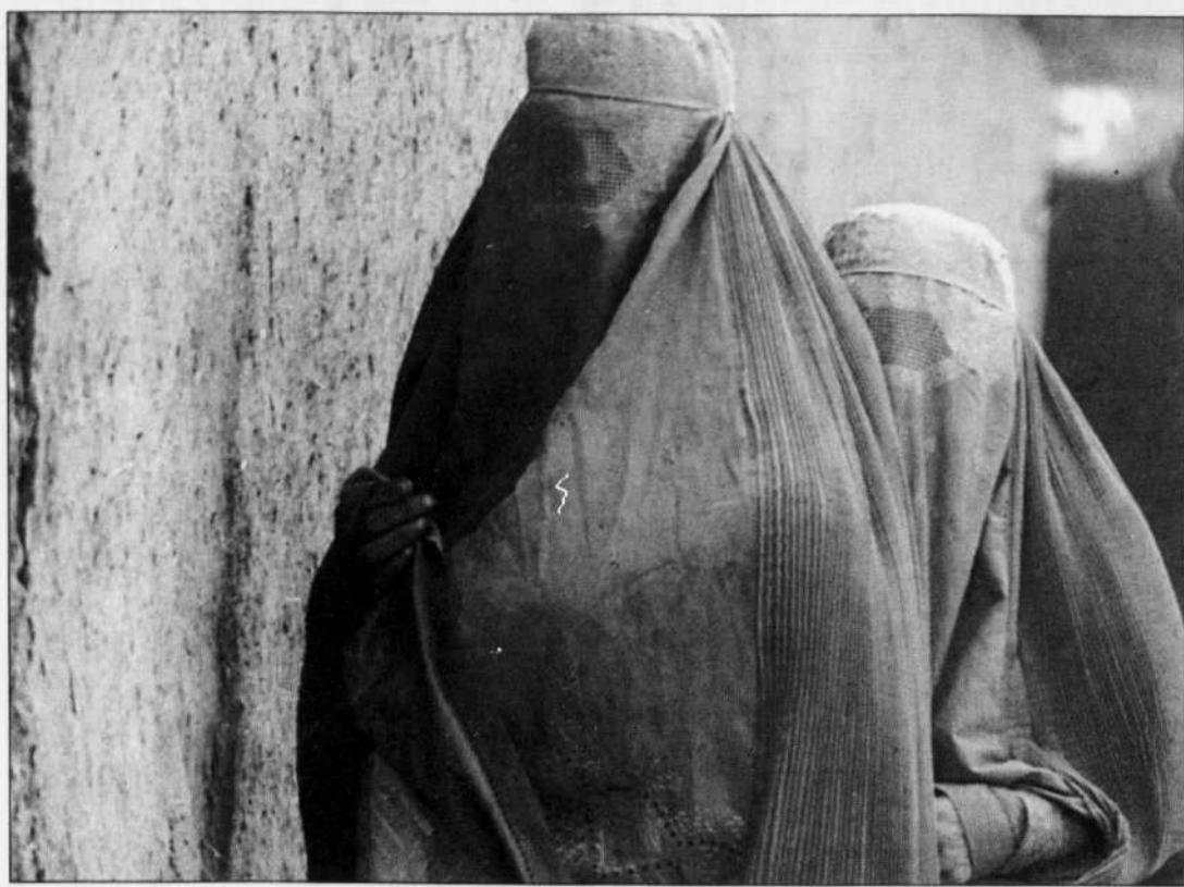
Des Afghanes voilées se promenaient hier dans les faubourgs d'Islamabad. Le Haut-Commissariat des Nations unies pour les réfugiés a repéré des sites pakistanais susceptibles d'abriter le millions de réfugiés afghans encore attendus.

Le Devoir est publié du lundi au samedi par Le Devoir Inc. dont le siège social est situé au 2050, rue De Bleury, 9 e étage, Montréal, (Québec), H3A 3M9. Il est imprimé par Imprimerie Québecor St-Jean, 800, boulevard Industriel, Saint-Jean sur le Richelieu, division de Imprimeries Québecor Inc., 612, rue Saint-Jacques Ouest, Montréal. L'Agence Presse Canadienne est autorisée à employer et à diffuser les informations publiées dans Le Devoir. Le Devoir est distribué par Messageries Dynamiques, division du Groupe Québecor Inc., 900, boulevard Saint-Martin Ouest, Laval. Envoi de publication — Enregistrement n° 0858. Dépot légal: Bibliothèque nationale du Québec.