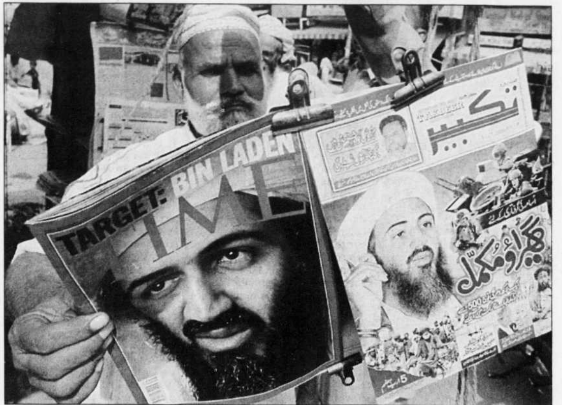
Oussama ben Laden, soupçonné d'être le commanditaire des attentats du World Trade Center et du Pentagone, était très «présent» hier dans les rues de Lahore, au Pakistan.

Parmi ce groupe figure Mohammed Atta, un Égyptien de 33 ans détenteur d'un passeport émirati, identifié par le FBI comme le kamikaze aux commandes du premier avion qui s'est écrasé contre une des tours du World Trade Center.