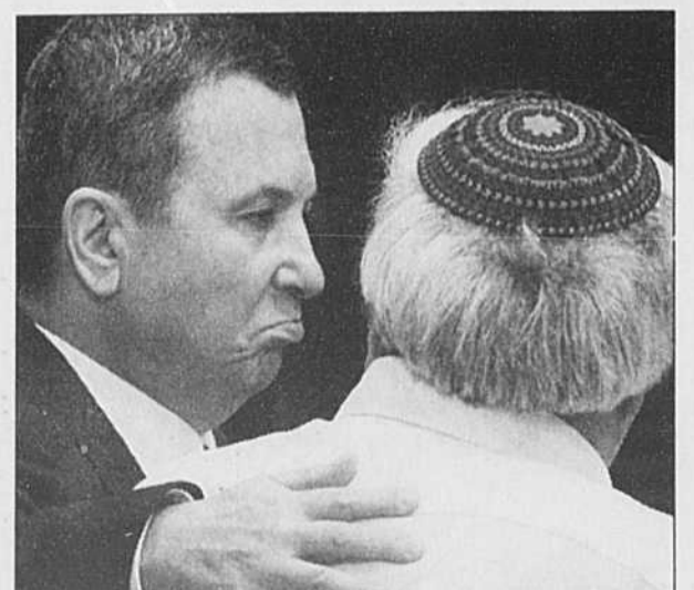
Le premier ministre israélien Éhoud Barak en compagnie d'un député du Parti national religieux, hier, à la Knesset.

■ À lire en page B1: Les chantiers d'Éhoud Barak