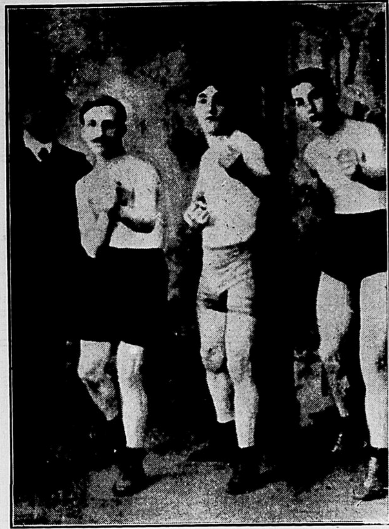
UNE FAMILLE DE BOXEURS. — Georges Carpentier est le seul vrai champion de sa famille...