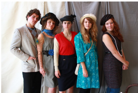
Jeunes de Katimavik, habillés par Cartier-Émilie

L'OBNL Cartier Émilie, situé à Bordeaux-Cartierville, est connu pour son implication dans le milieu surtout pour la récupération des objets offerts par les résidants et qui sont ensuite vendus à petits prix.