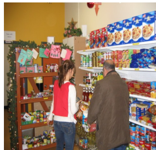
Magasin Émilie

Magasin d'Émilie (épicerie communautaire) pour les personnes admissibles, dépannages, OLO (femmes enceintes)