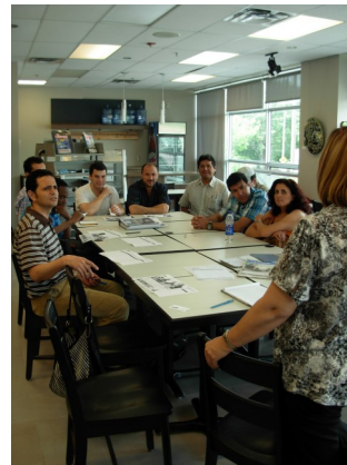
Résidants du quartier lors d'un atelier sur l'entrevue d'embauche

Depuis septembre 2010, la Corporation de développement économique communautaire (CDEC) Ahuntsic-Cartierville offre aux résidants du secteur «Laurentien -Grenet», à la recherche d'un