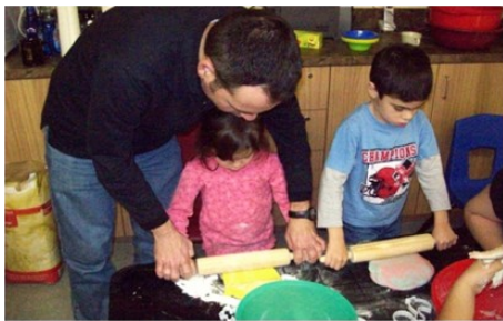
Atelier cuisin-pères

Bâtir ensemble un quartier à notre image ! www.clic-bc.ca