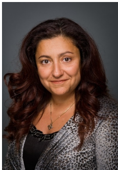
Mme Maria Mourani, députée d'Ahuntsic

Le Bureau de Maria Mourani, députée fédérale d'Ahuntsic, peut aider les citoyennes, les citoyens et les organismes de son territoire qui ont des problèmes avec l'administration fédérale relativement à différents sujets, dont notamment :