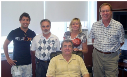
Équipe de Tandem Ahuntsic-Cartierville

Tandem est un programme montréalais de soutien à l'action citoyenne en sécurité urbaine qui vise à augmenter la sécurité et le sentiment de sécurité. L'équipe en place, soutenue par une patrouille à vélo, une brigade anti-graffitis et une patrouille éducative, informe, sensibilise et mobilise les citoyens de tous âges pour que chacun adopte des attitudes et des comportements propices à la sécurité.