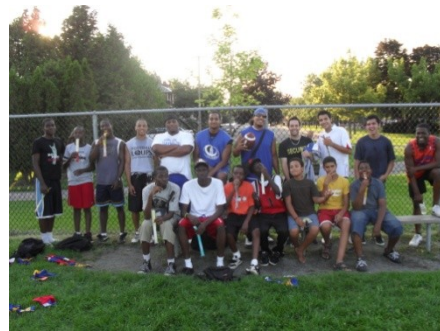
Des jeunes de la MDJ après une activité de flag football avec les Carabins de l'Université de Montréal, - Photo Dave Nicolas

La Maison des jeunes est une ressource mise sur pied par les jeunes et les différents acteurs du quartier afin d'offrir aux adolescents un lieu de rencontre animé, accessible et disponible qui leur offre une écoute de leur vécu, un soutien éducationnel en complémentarité avec l'école et qui leur permet de se donner la possibilité d'expérimenter leur liberté. La Maison des Jeunes poursuit également comme objectifs de développer chez l'adolescent le sens des responsabilités, de favoriser une implication dynamique de sa part dans la communauté et de contribuer à la prévention de la délinquance par l'implication d'adultes significatifs.