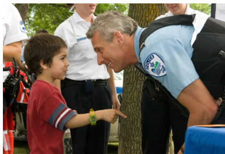
Un enfant de notre quartier échange avec un policier lors de la fête de famille, 2007 au parc Louisbourg

Le Poste de quartier 10 met tout en œuvre afin de garantir un milieu de vie sécuritaire aux citoyens de Bordeaux-Cartierville. Il offre à la population les services policiers de base, 24 heures sur 24, sept jours sur sept, en plus de travailler en concertation avec ses partenaires afin de trouver des solutions durables aux problématiques de sécurité locales.