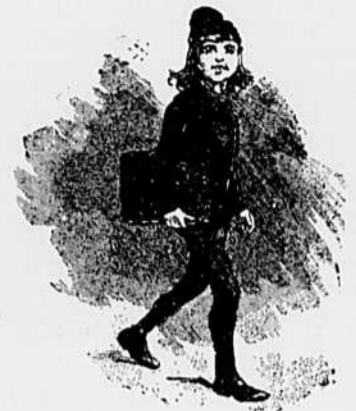
III.—Le pur et noble courage du jeune âge.