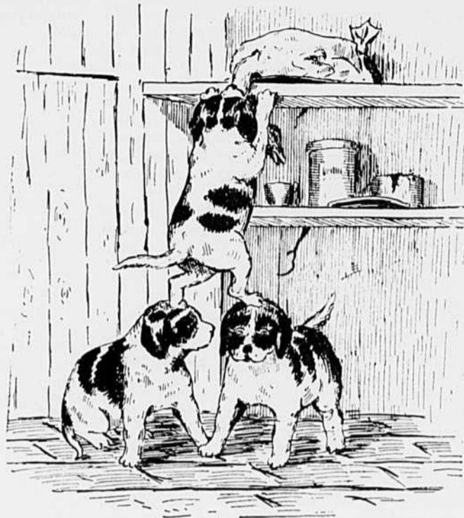
Plus de misère pour les pauvres gens. Hourrah !