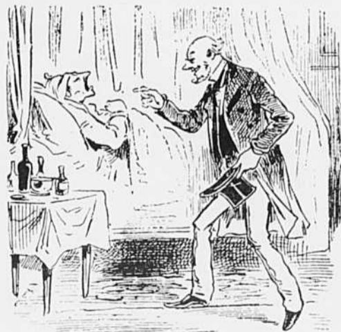
—Ah ! satané farceur, va ! qui se rend bien malade pour s'éviter de donner des étrennes !... C'est pas bête, ça, veinard !