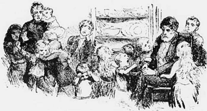
VIII.—Les sueurs du pain qu'il faut gagner pour douze petites bouches sont parfois bien amères.