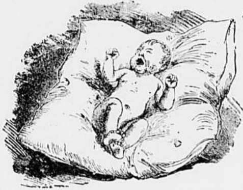
I.—On crie.—C'est la vie