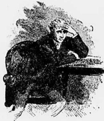
VI.— Oh ! mort, viens me délivrer, elle ne voudra jamais