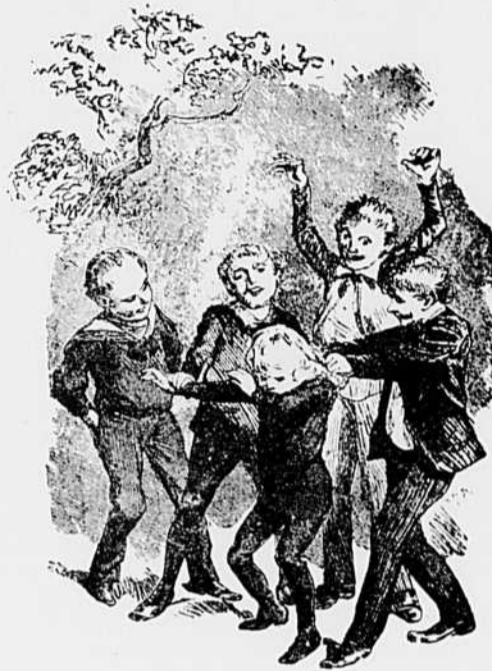
II.—La première lutte pour l'existence