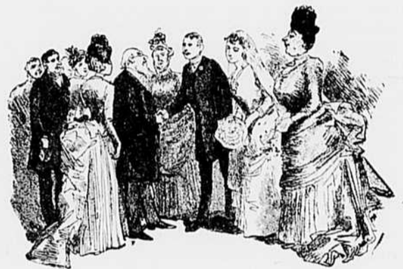
VII.—Sublimes réjouissances de la vie ! Elle a voulu.