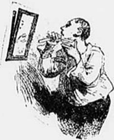
V.—Tout va mal aujourd'hui : le rasoir et le cœur : elle la refusé