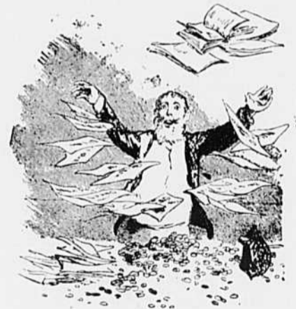
IX.—Enfin ! Un coup de fortune. L'abondance !