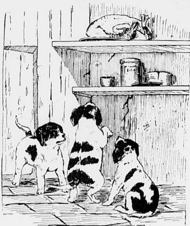
Carlo.—Faut pourtant fêter le jour de l'an.