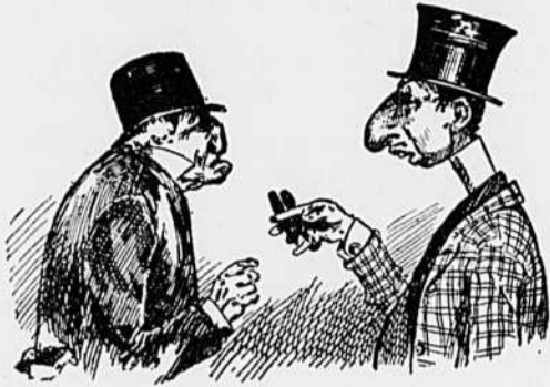
I —Fumez-vous ?