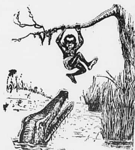
—Oui, mon enfant, j'ouvre tous les jours.