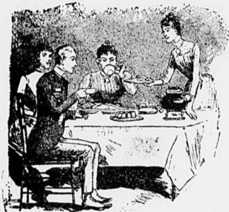
IV.—Les délices de la première rencontre