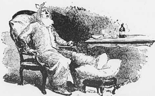
X.—Avec l'abondance, les jouissances et leur fatal cortège