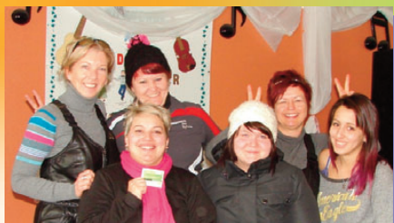
Les élèves du groupe de coiffure ont reçu des cartes-hommage dans le cadre des Journées de la persévérance scolaire .