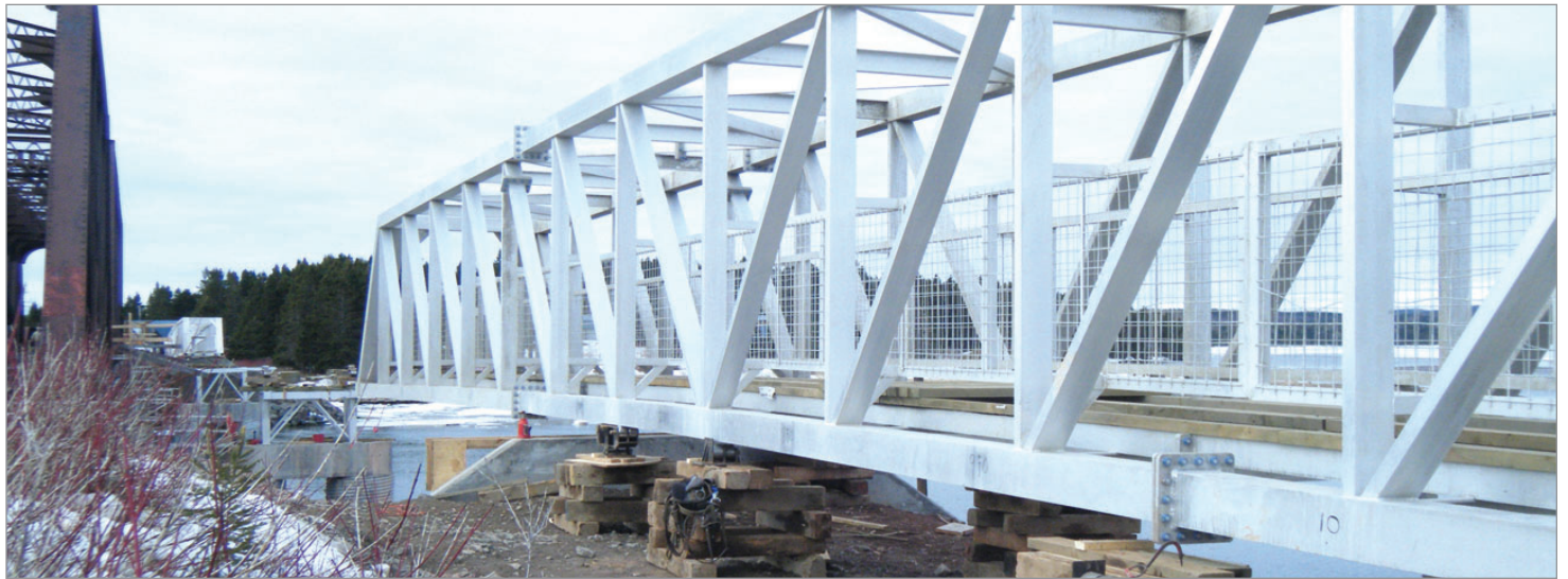
La passerelle en semi-suspension, en route vers son premier pilier.

www.hebdosregionaux.ca/gaspesie/mon-topo