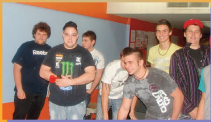
Allez les gars! À qui le meilleur abat? (activité au salon de quilles avec les adultes de Chandler)