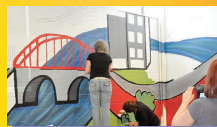
Le salon étudiant du centre La Ramille en pleine séance de décoration