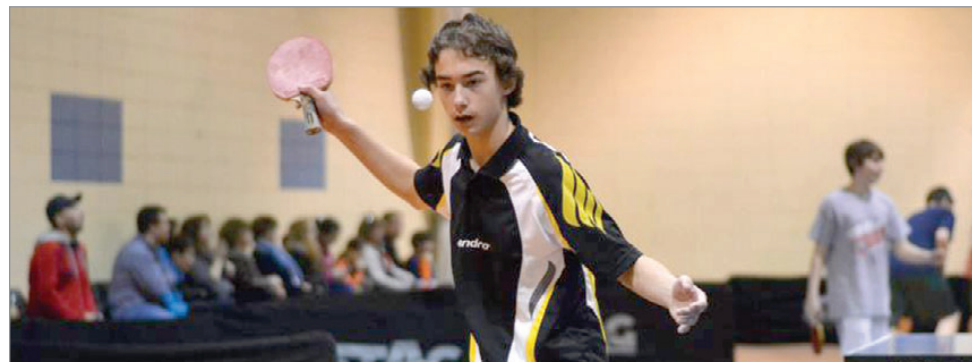
Chandler a été représentée aux Jeux du Québec en tennis de table

polyvalente de Chandler se sont rendus à Saguenay, afin de disputer le tournoi provincial de