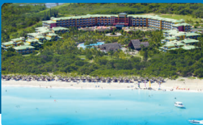
MELIA LAS ANTILLAS