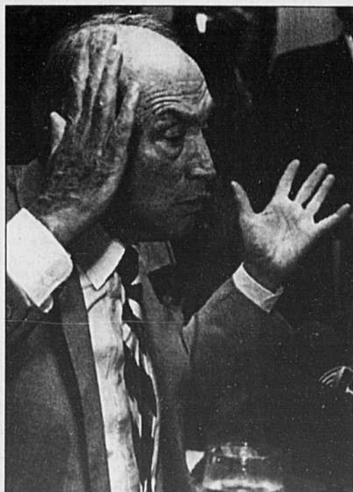
L'ancien premier ministre a imposé une conception rigide qui bloque aujourd'hui toute évolution, selon son ancien conseiller.

Pierre Elliott Trudeau a ses fidèles et jamais ceux qui ont travaillé à ses côtés n'ont dévié publiquement de sa pensée.