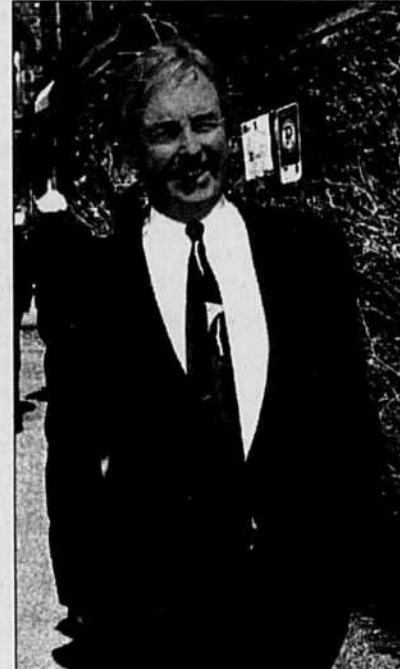
Le Solliciteur général Doug Lewis.

Les tribunaux auraient le pouvoir, par ailleurs, d'exercer une étroite surveillance sur ces criminels,