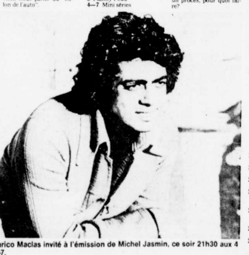
Enrico Macias invité à l'émission de Michel Jasmin, ce soir 21h30 aux 4-7.

18h00 3 The News 4 Aujourd'hui... 18h00 5 Newswatch 5p Nightly News on 5 7 Le monde 11 Ce soir 12 Pulse 22 News Center 22 57 Making It Count 99 Devenez musicien R-Q, Passe-Partout 18h05 11 Nouvelles régionales 18h20 11 Nouvelles du sport 18h25 11 La météo 18h30 5p NBC Nightly News 11 Avis de recherche 22 ABC World News Tonight 57 The Nightly Business Report 99 Des chiffres et des lettres R-Q, Téléservice 18h40 9 Le 9 vous informe 13 Le 13 vous informe et les sports 18h55 9 Nouvelles du sport 18h57 R-Q, L'agence D.D.T.