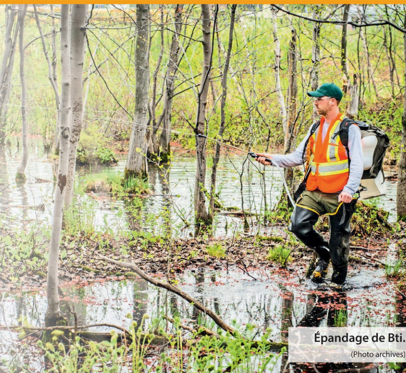
Épandage de Bti.

«Je reconnais également la protection durable des habitats et des espèces menacées ou vulnérables, comme on retrouve dans la rivière Bécancour, afin de favoriser la préservation de la biodiversité. Il est évident que cette orientation entraîne des enjeux sur la nuisance pour l'homme. Cependant, je crois que c'est une des adaptations que l'humain doit faire afin de favoriser, protéger et préserver les écosystèmes et l'environnement, et pour finalement offrir un avenir meilleur aux générations futures», a-t-il conclu.