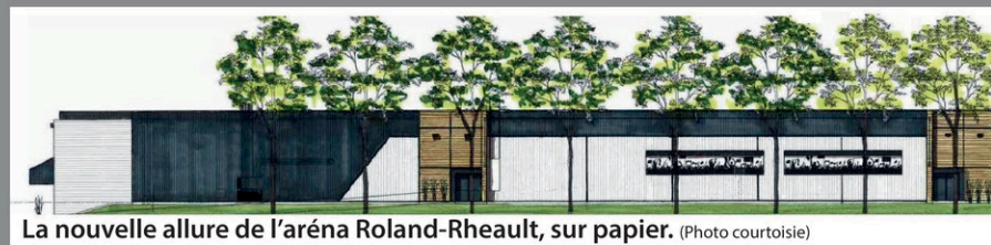
La nouvelle allure de l'aréna Roland-Rheault, sur papier.

réaménagement de salles de toilette, des douches, de la cantine et d'un escalier. Notons que le système de réfrigération de l'aréna a été réparé en 2023 pour la somme de 50 000$.