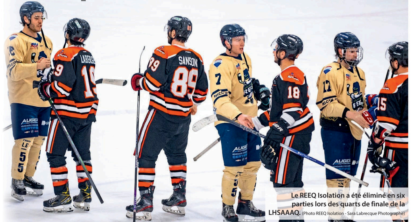
Le REEQ Isolation a été éliminé en six parties lors des quarts de finale de la LHSAAAQ.

Ils se réjouissent de savoir que tous les joueurs ont déjà très hâte d'enfiler à nouveau leurs uniformes. « Plusieurs ont déjà recontacté Karl afin de manifester leur désir de revenir car nous avons