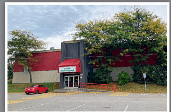
L'aréna Roland-Rheault de Bécancour.

Les travaux comprennent notamment la réfection de l'enveloppe du bâtiment et le