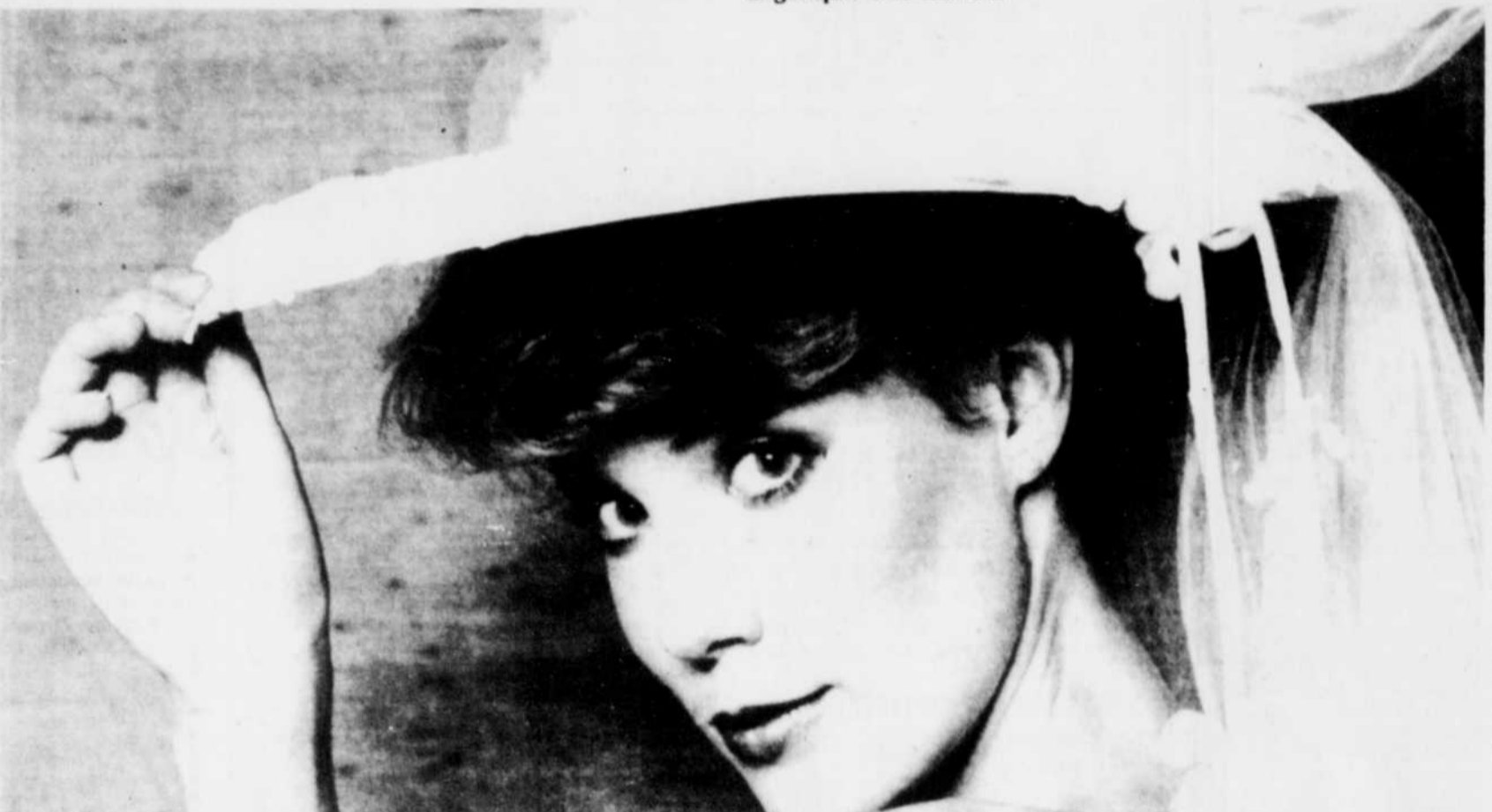
Si le mariage est célébré au printemps, un chapeau à large rebord orné de satin et de dentelle attirera des regards envieux.

"J'ai vu des gens s'endetter jusqu'au cou pour célébrer un de ces