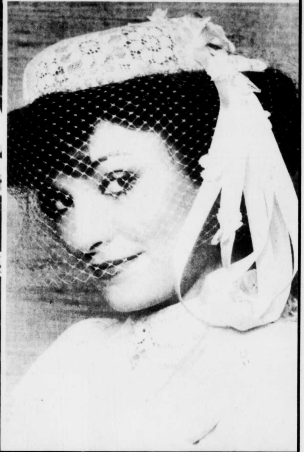
Le tafetas, le satin et la touche classique redeviennent de bon ton. Pour les chapeaux: coton français, dentelle, perles et fleurs.