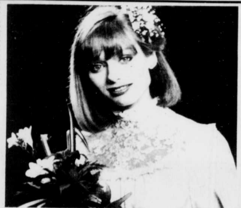
Robe traditionnelle en poly satin de Hyman Hendler pour Burda Patterns. Col d'organza avec parements de dentelles.