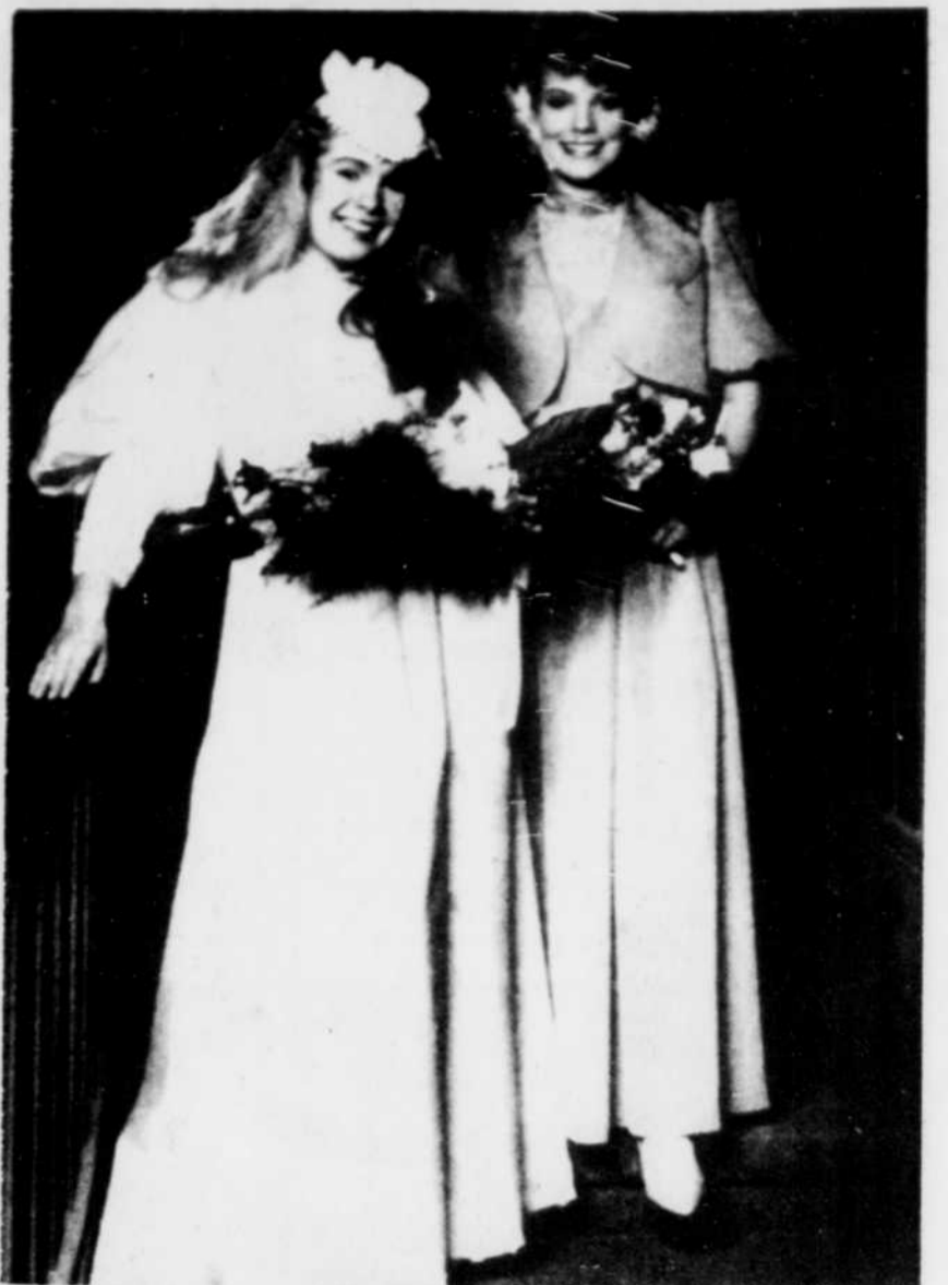
La mariée porte une robe de tafetas ivoire, sans traîne, décorée de dentelle vénitienne tandis que sa demoiselle d'honneur a une robe de tafetas de couleur avec jaquette boléro et manches bouffantes. Réalisation de Eatons.

La mère de la mariée et sa bouquetière pourront porter à leur gré une tenue courte ou pleine longueur, mais les deux devront choisir des tenues de même longueur. Les toutes dernières couleurs pour elles se situent dans les tons de brun et de gris, en chiffon, mais surtout pas du tafetas, prévient Mme Kaplan.