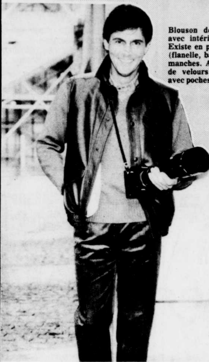
Blouson de cuir signé Paparazzi, avec intérieur en tissu de mouton. Existe en plusieurs matières (flanelle, bâche) avec ou sans manches. Accompagné d'un pantalon de velours côtelé câblé, à pinces, avec poches arrière à revers.