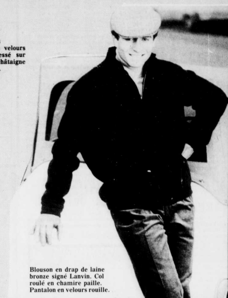
Blouson en drap de laine bronze signé Lanvin. Col roulé en chamire paille. Pantalon en velours rouille.

par Jacqueline Claude PARIS (AFP) — "Le blouson, vous dis-je... le blouson!" C'est ce que, parodiant Molière, on peut aujourd'hui affirmer en ce qui concerne la mode masculine pour l'hiver prochain (1983-84).