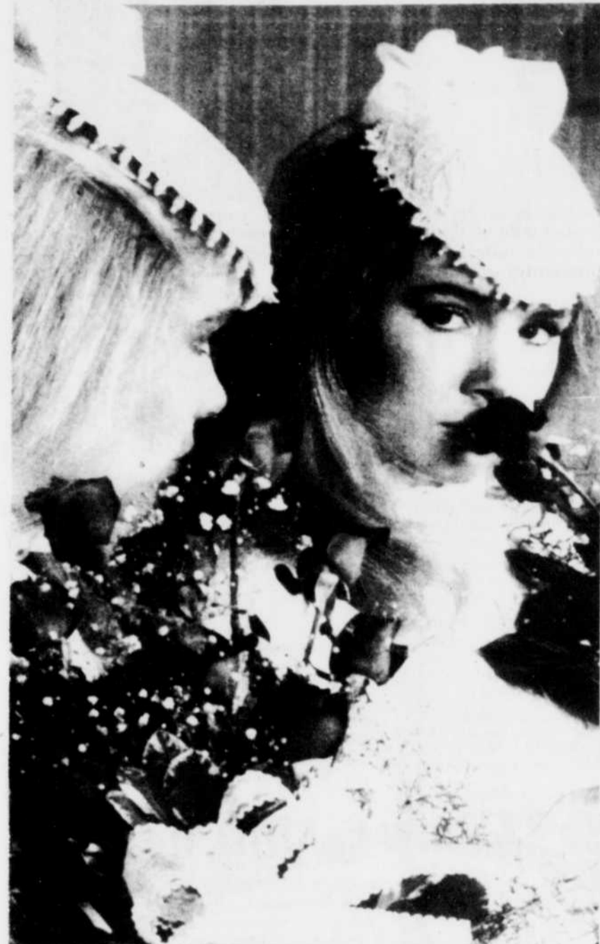
Un chapeau de dentelle de Venise constellée de perles et un bouquet de roses rouges rehausseront la beauté de la mariée.

ans. Toutefois, rappelle-t-elle, les mariages ne sont plus exactement ce qu'ils étaient.