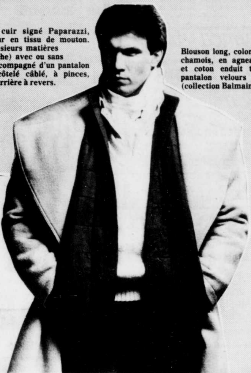
Blouson long, coloris chamois, en agneau velours et coton enduit tressé sur pantalon velours châtaigne (collection Balmain).