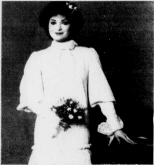
Cette robe de mariée d'après-midi est d'Emanuel Ungaro pour Vogue Patterns.

Une couturière s'occupe alors de coudre la doublure, alors que plusieurs autres employées crochent ou tricotent la petite merveille. Mme Leman effectue elle-même toutes les retouches de l'oeuvre terminée.