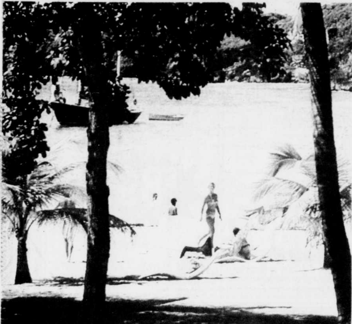
Aux amants du soleil, Paradise Island offre d'interminables plages de sable doré ombragées par des palmiers, à moins d'un kilomètre du coeur de Nassau.

Les plus typiques de ces établissements et ceux qui attirent le plus les amateurs d'exotisme sont certes Traveller's Rest, en bordure de la mer, sur Bay Street, et Poop Deck Restaurant, qui surplombe le port de Nassau, près du pont menant à Paradise Island.