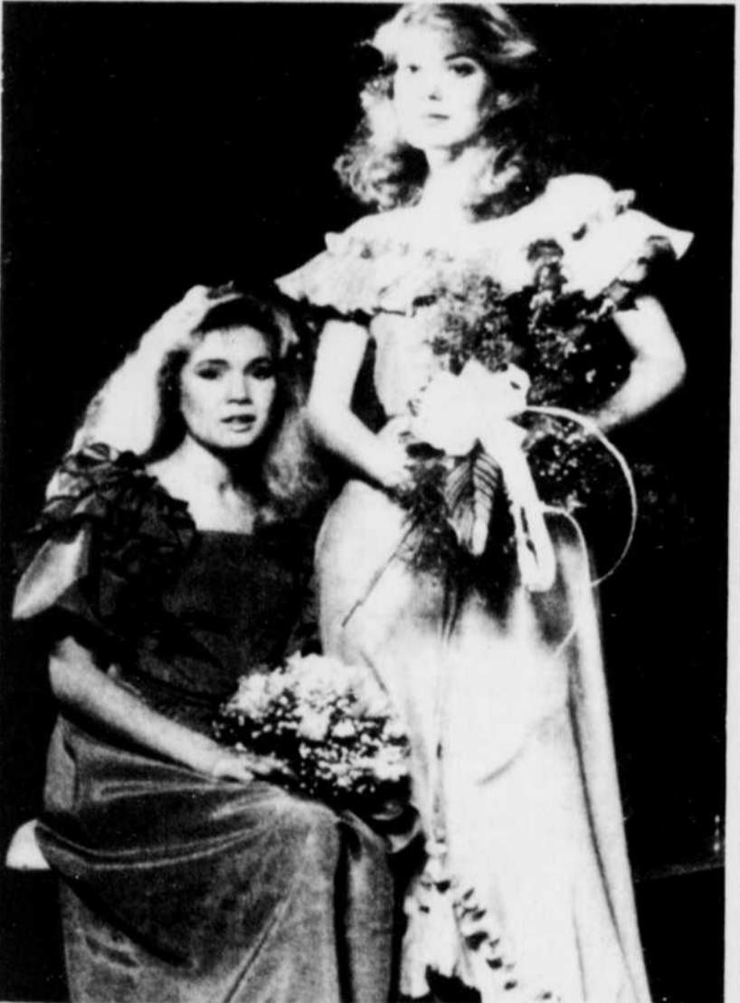
Les robes de mariées 1983 sont très féminines comme le suggèrent ces deux robes disponibles en 14 couleurs, de Eatons.