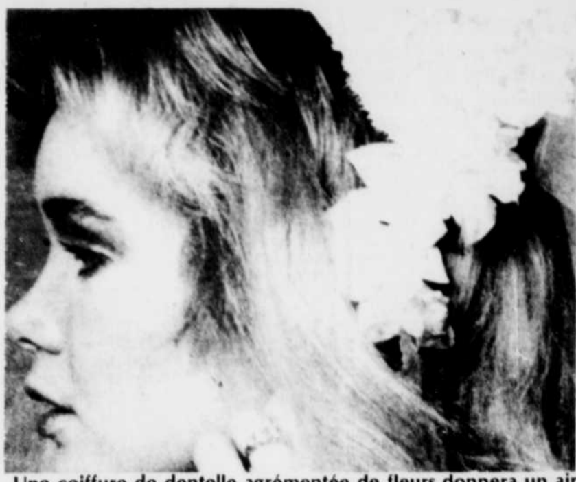
Une coiffure de dentelle agrémentée de fleurs donnera un air angélique à la mariée.

Lorsque les clichés sont pris juste après la cérémonie officielle et avant la réception, les invités s'affairent encore à se démêler et doivent se débrouiller seuls, ce qui devient un problème particulièrement gênant pour les gens qui ne viennent pas du même patelin.