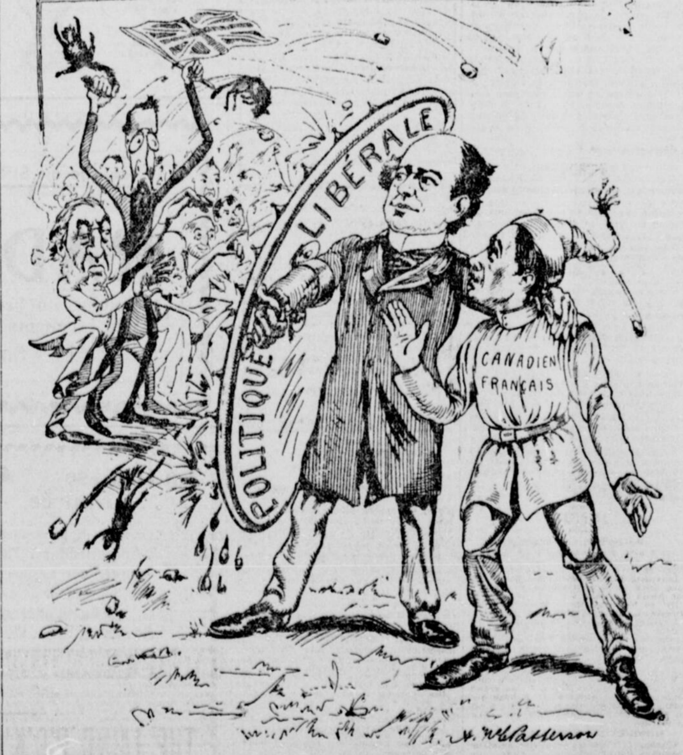
LAURIE—N'aie pas peur Baptiste: Je saurai bien te protéger contre cette bande d'affamés et de fanatiques.

L'inspection des édifices publics, figurait au budget de 1897 pour une somme de $17,028.38. Sans diminuer en rien l'efficacité de ce service, mais en réduisant tout simplement les dépenses à des proportions rationnelles, le ministre des Travaux Publics actuel, a rogné ce chiffre et l'a fixé à $2,310.17, soit une formidable réduction de 628 p. c.