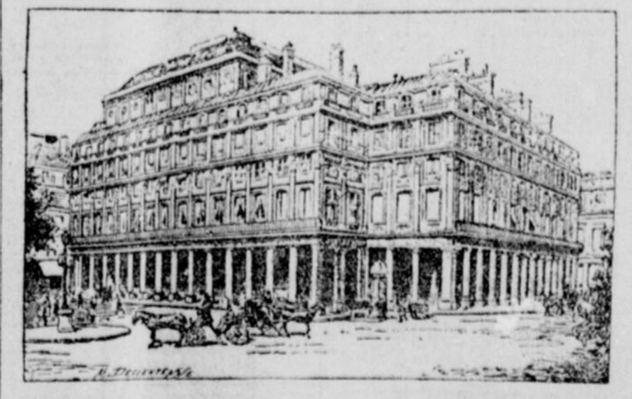
LE THEATRE INCENDIE

Il contenait nombre de magnifiques statues, bas-reliefs et tableaux. C'est une perte irréparable. L'incendie a éclaté vers midi, mais on ne s'en est pas aperçu immédiatement et l'incendie faisait rage avant que les pompiers aient pu commencer à le combattre. Vers 1 heure et demi l'incendie de l'édifice n'était plus qu'une fournaise ardente. L'épaisse colonne de fumée qui s'en échappait attirait une foule immense de tous les coins de Paris, surtout quand on sut que c'était le Théâtre Français, com-