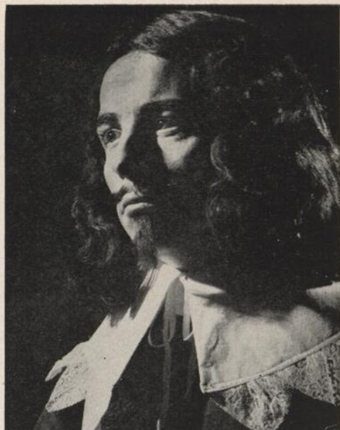
JEAN DEGIVES (Louis XIII)