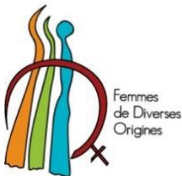
Femmes de Diverses Origines

Nous dénonçons les attaques américaines contre la Syrie perpétrées le 6 avril. Femmes de diverses origines est une organisation de femmes engagées pour la paix fondée sur la justice et opposées à