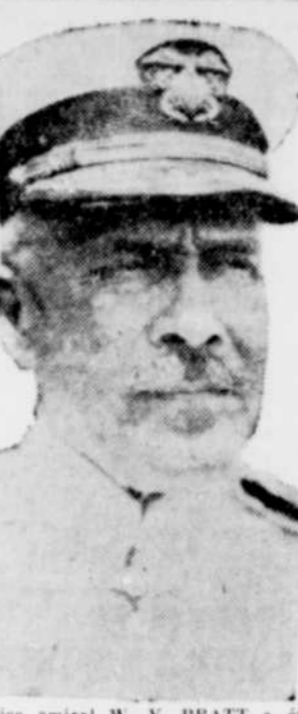
Le vice amiral W. V. PRATT a été promu ces jours-ci au rang d'amiral et mis en tête de la flotte américaine. Le 26 juin succédera à l'amiral Louis R. de Steigner.

En cours de route les immigrants de la jungle bénéficient d'un menu spécial préparé par un chef du service des restaurants du Canadian National. Les deux ours ont chaque jour un plat de riz au lait, du pain, des biscuits et de fruits frais. Les calaos se nourrissent de riz bouilli, de viande hachée et d'œufs durs. Le tigre mange trois livres et demi de viande le matin et la moitié de cette ration le soir alors que le léopard se contente de 5 livres de viande fraîche le soir pour ses repas quotidiens. Le "Kabinga" a aussi emporté à Halifax deux autres congénères d'animaux sauvages dont l'une destinée au jardin zoologique de New-York. Parmi les centaines de singes ainsi transportés plusieurs sont morts en mer et le dernier est mort à son arrivée à Halifax juste à temps pour servir de repas au l'hopital en route pour Toronto.