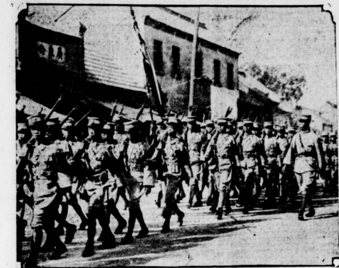
L'armée des nationalistes chinois sous le commandement du général Chiang Kai-Shek ne serait qu'à quelques milles de Pékin, la forteresse des forces nordistes du général Tso-Lin. On s'attend que les nordistes qui ont souffert et la part des nationalistes vont évacuer la capitale de la Chine et se retirer en Mandchourie. La photographie ci-dessus montre les troupes de l'armée nationaliste en marche à travers la région de Tain Fu.