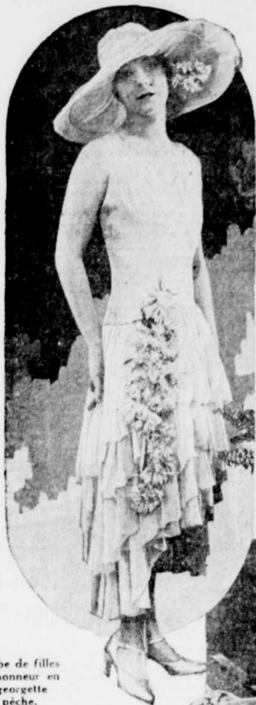
Robe de filles d'honneur en georgette pêche.

Il se fait une campagne vigoureuse contre les cérémonies religieuses du mariage. On voudrait même réduire et éliminer à une simple formule dépourvue de tout appareil extérieur. Ce mariage ne veut plus voir ces bouquets, ces pages et toutes ces démonstrations si caractéristiques de la joie et du bonheur d'un jour semblable. Mais la mode ne s'en préoccupe pas, mais elle s'occupe énormément de tout ce qui concerne la beauté, la grâce, l'élégance de la robe et du voile de la mariée en s'élevant surtout à partir des modèles toujours plus beaux et plus chics.