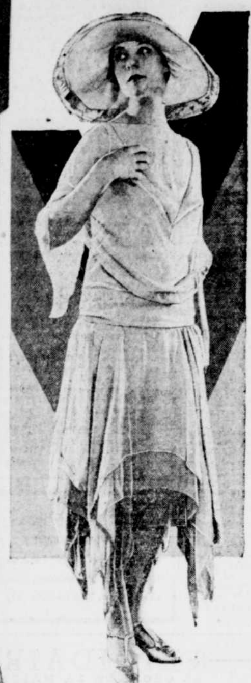
Robe de fille d'honneur illustrant l'encolure nouvelle.

Paris Saks Les nouveaux colliers encerclant le cou (Chokers) sont en perles beiges.