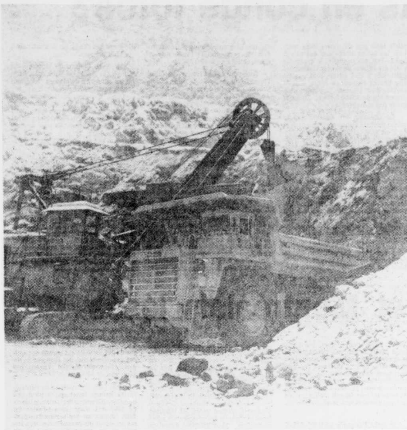
L'extraction de l'amiante se fait de la même façon au Canada et en URSS, mais dans ce dernier pays, les usines de traitement sont situées loin des mines.