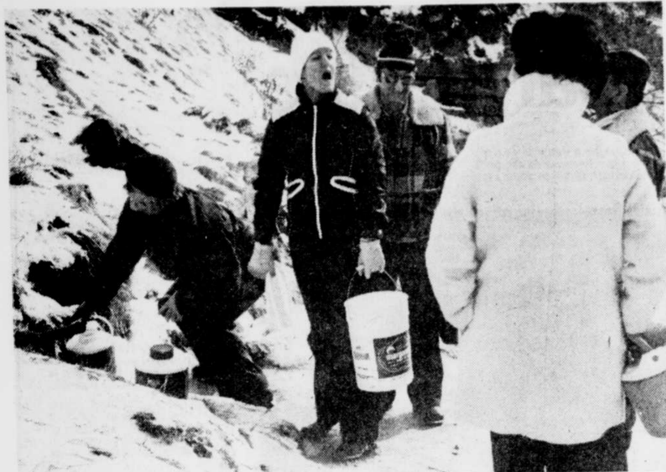
Par le temps qui court, les citoyens de Vallée-Jonction doivent faire un retour aux sources pour s'approvisionner en eau potable, celle de leur réseau d'aqueduc étant trop polluée.

D'après le député Ouellette, "on se doit de faire une enquête globale en inspectant toutes les installations d'éleveurs de porcs en bordure de la rivière Morency, afin qu'une telle situation ne se produise plus, et que, s'il le faut, on entreprenne des poursuites judiciaires à l'endroit des éleveurs de porcs qui seront trouvés coupables".