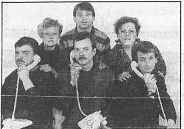
La compagnie de théâtre Trouvarir présentera prochainement une production de Sylvie Lemay, «Tu peux toujours me téléphoner»

La salle-théâtre Les Loges, anciennement l'Eskael, on présente du 9 au 26 mars, Big bang blues , un récit homérique de Diane Blanchette. Il s'agit de son premier texte