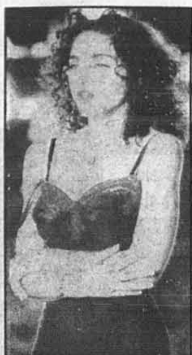
Une séquence du vidéoclip de Madonna Like a Prayer

Chez nous, Musique Plus compte le diffuser à tous les huit heures. Au Canada anglais, Much Music avait décidé mardi de le maintenir.