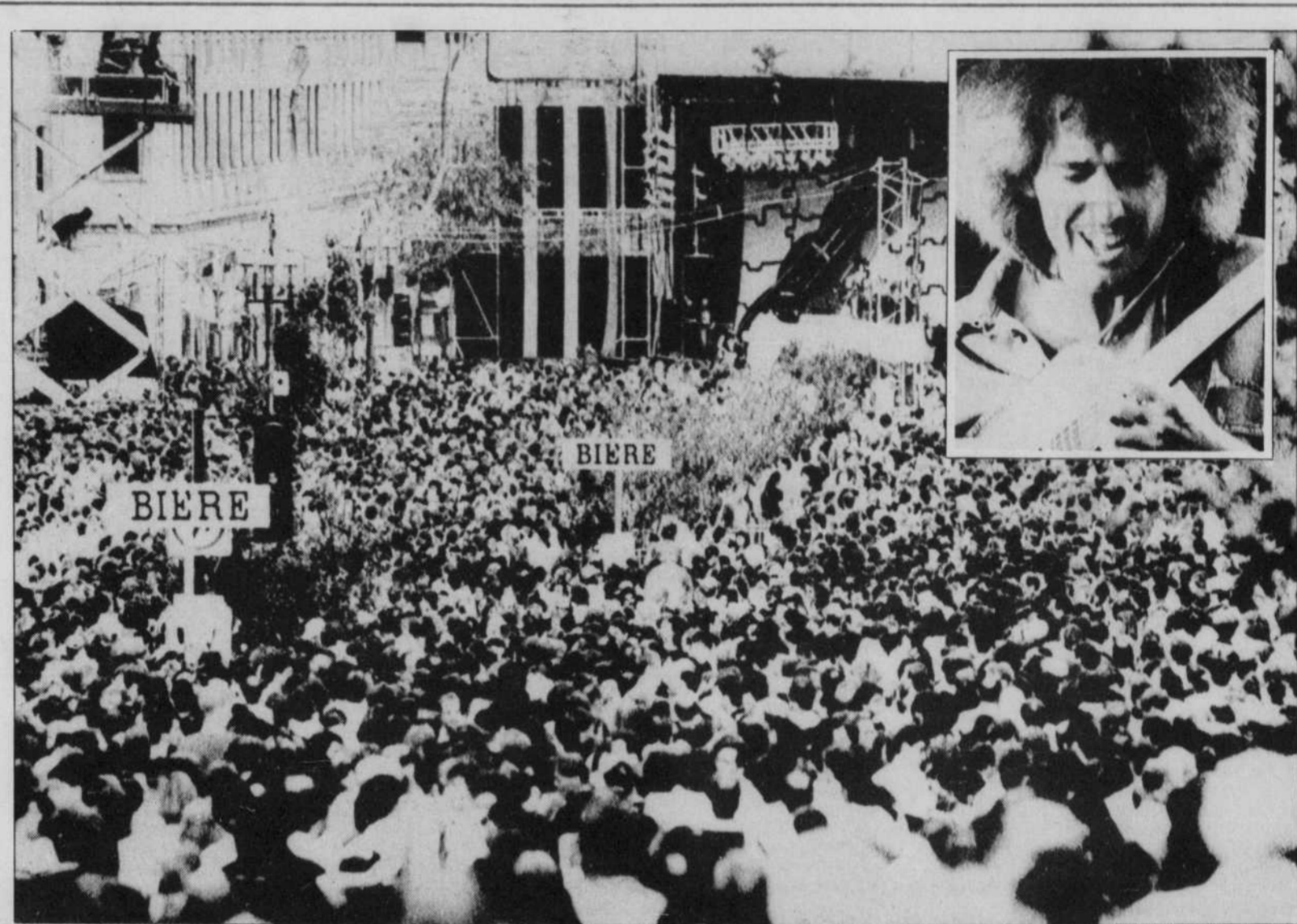
Une foule d'environ 100,000 personnes s'est rassemblée hier soir sur l'avenue Mc Gill College pour écouter le guitariste Pat Metheny (en mortaise), dans un spectacle qui a fracassé les records d'assistance du festival