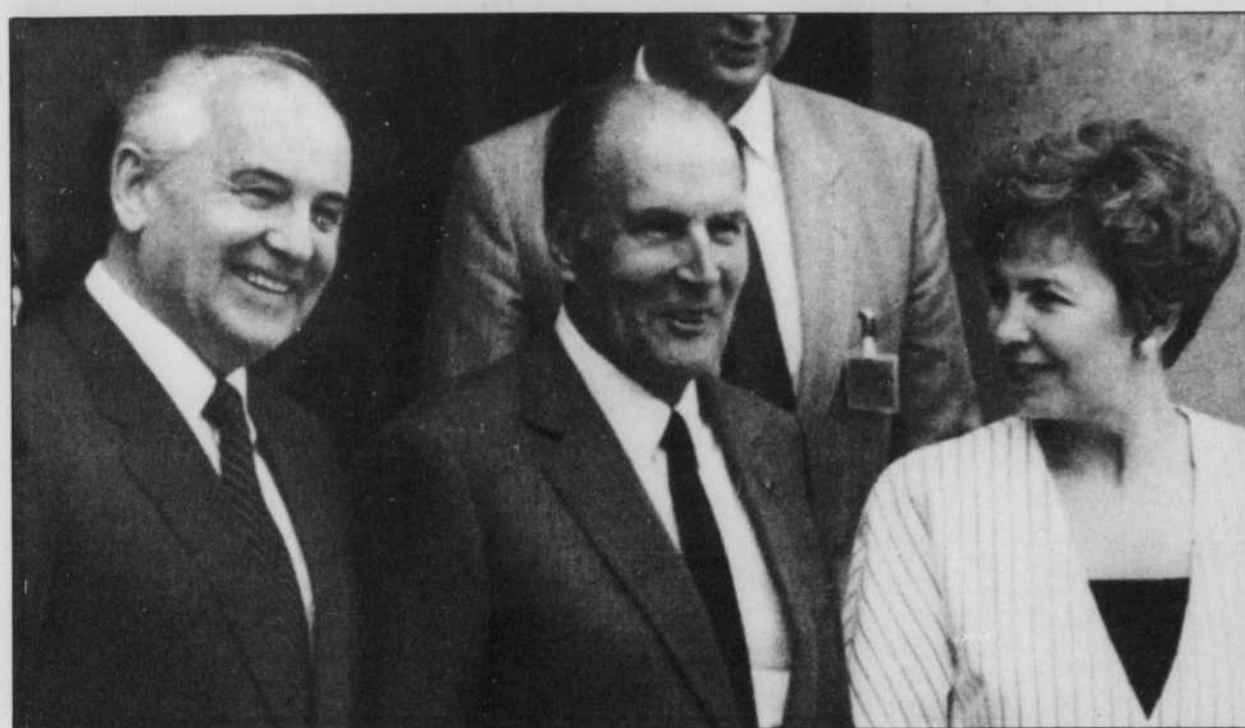
Le président français, François Mitterrand, a accueilli hier le numéro 1 soviétique Mikhaïl Gorbatchev et son épouse Raïssa pour leur visite de trois jours en France.

« Nous parlerons de nous, nous parlerons de l'Europe », a dit encore M. Mitterrand, tandis que son invité exprimait son appréciation du dia-