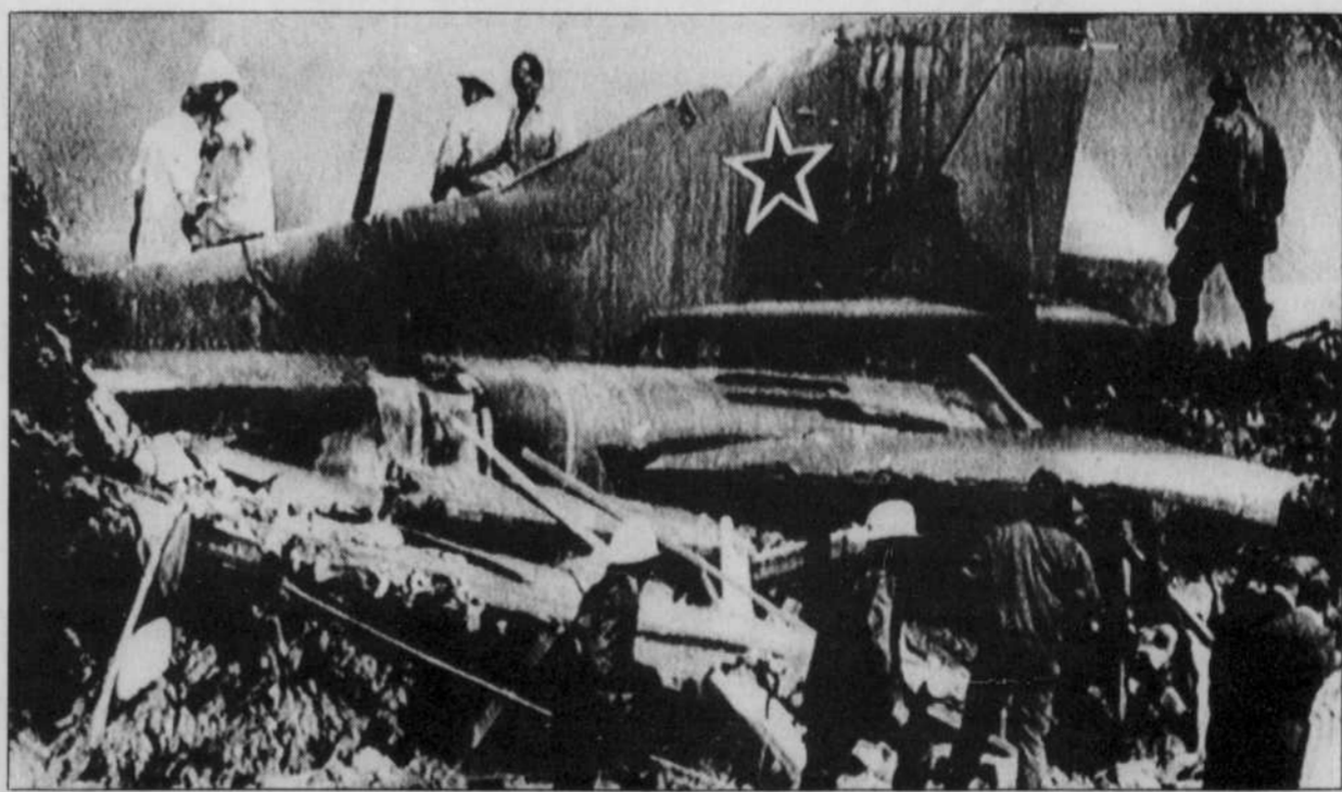
La carcasse du Mig-23 soviétique qui s'est écrasé sur une maison de ferme en Belgique, tuant un jeune homme de 19 ans, hier, après avoir traversé l'Allemagne et la Hollande sans pilote.