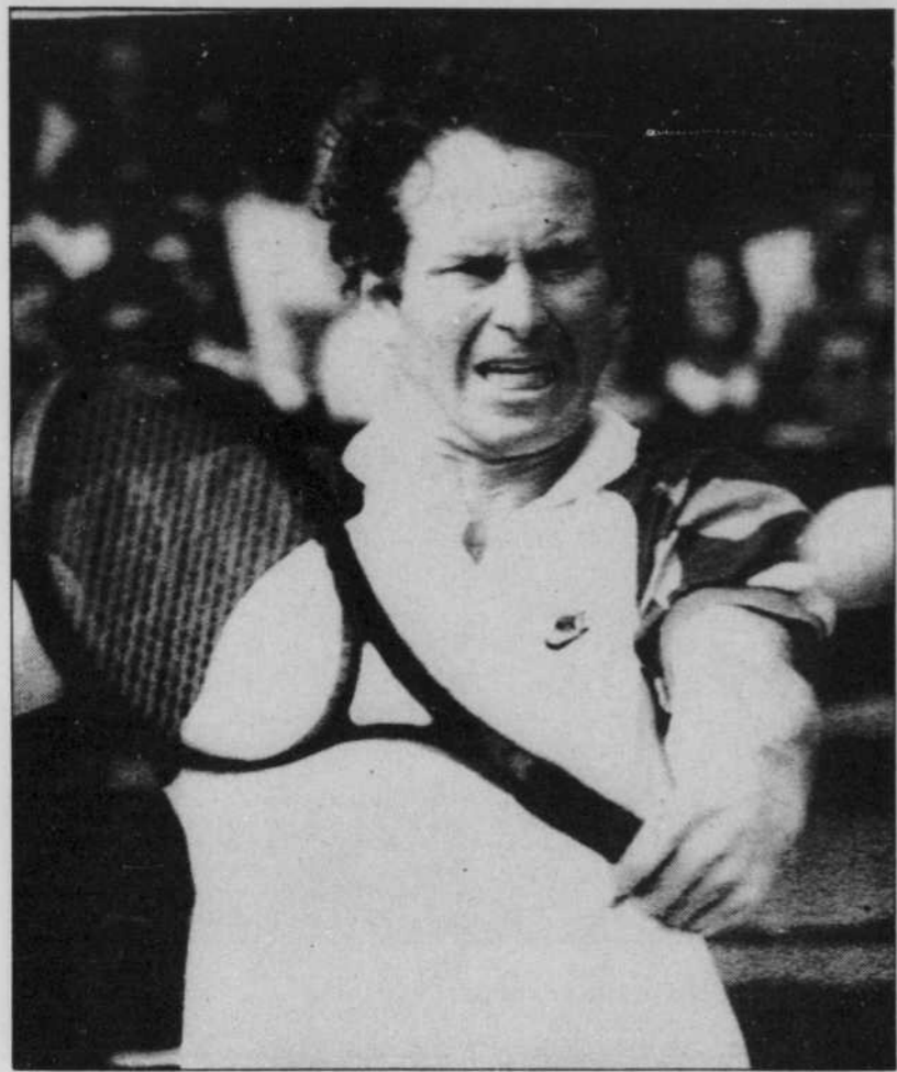
John McEnroe a pris, lundi, la mesure de l'Australien John Fitzgerald pour parvenir aux quarts de finale. Son adversaire, aujourd'hui, sera Mats Wilander qu'il affrontera pour une 13e fois depuis 1982. Les deux joueurs se partagent le nombre de victoires.