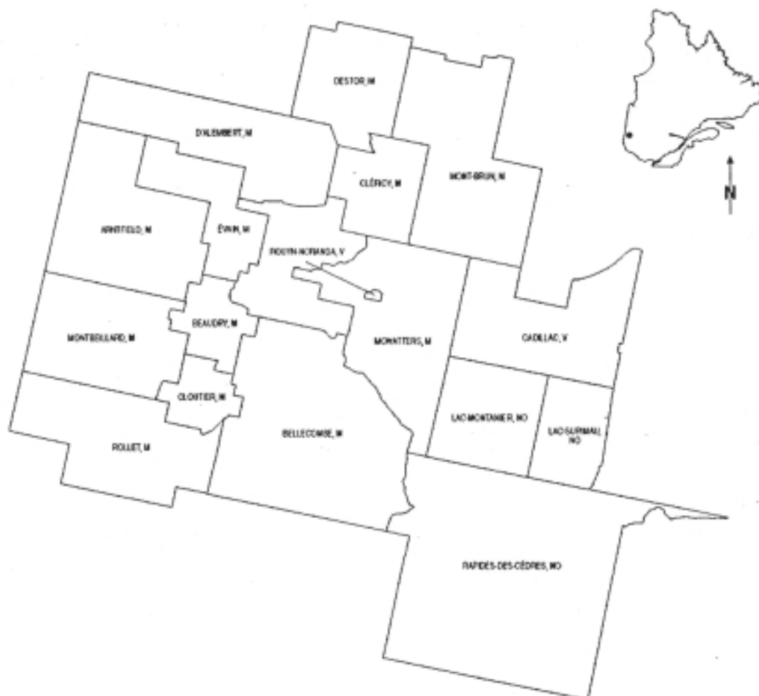
Figure 2 : La population et la superficie de la Nouvelle Ville de Rouyn-Noranda