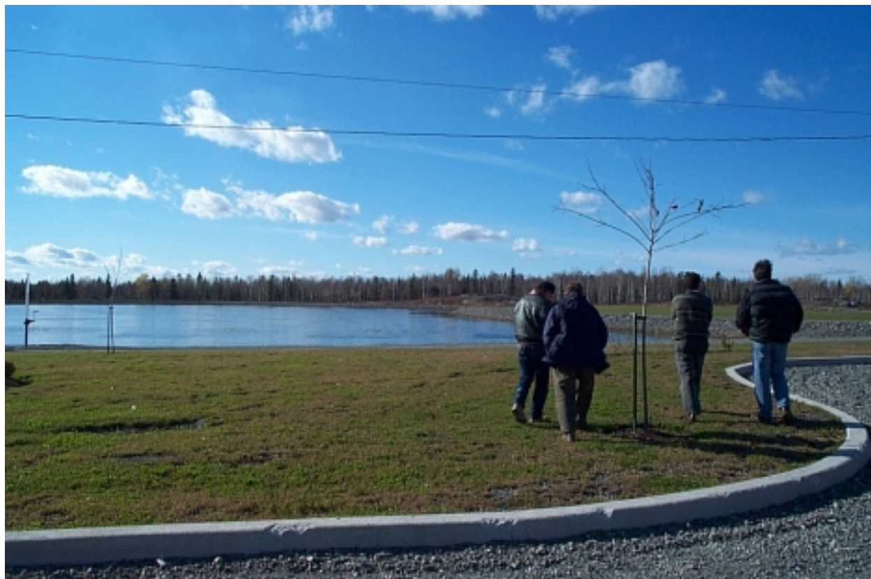
Figure 6 : Étangs aérés de traitement des eaux usées de la Ville

Au départ, l'initiateur du projet prévoyait un système actif de captage et d'élimination des biogaz par incinération. Cependant, l'abandon de la cellule n° 2 ainsi que l'abandon de la recirculation des eaux de lixiviation font en sorte que l'incinération des biogaz n'est plus nécessaire. Ils seront captés et évacués par un réseau d'évents sur le site. Un total d'environ 60 événements d'évacuation seront installés aux croisements des conduites de captage des biogaz dans chacune des cellules.