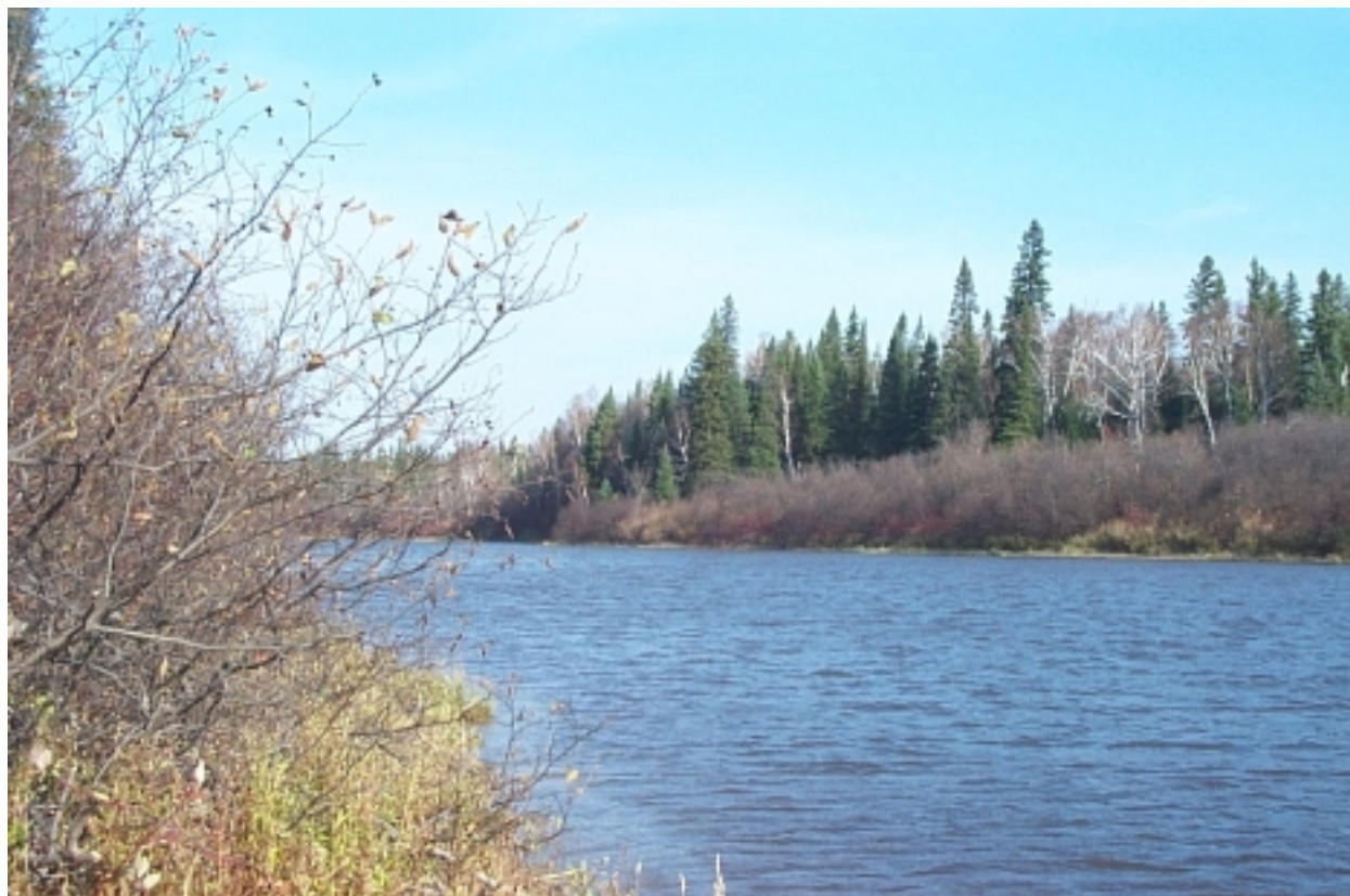
Figure 7 : La rivière Kinojévis à l'endroit du projet de LES

lixiviation se situait à une élévation d'environ 275 m, ce qui est établi par le spécialiste de l'Université Laval comme étant la valeur minimale de la crue centennale. C'est dans ce contexte que l'initiateur s'est engagé, lors de l'audience publique, à relocaliser les infrastructures de gestion des eaux.