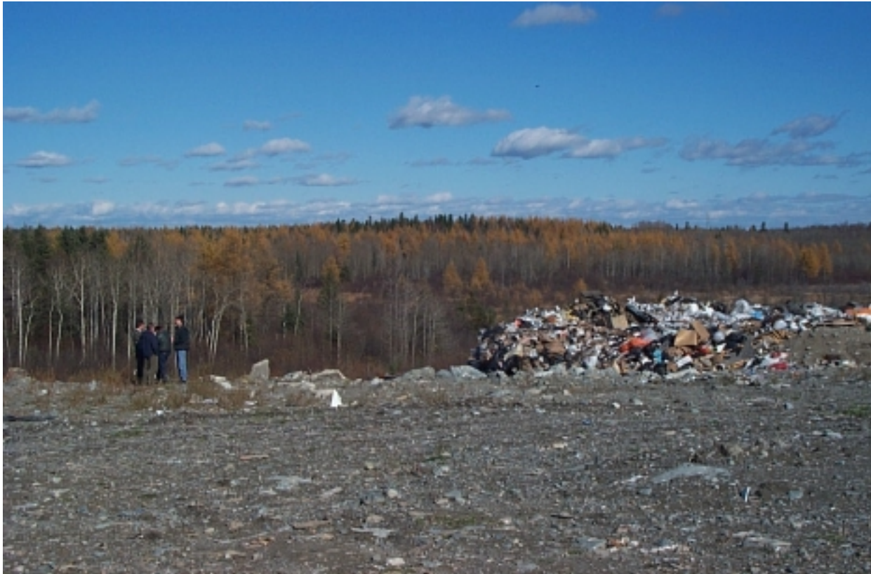
Figure 3 : Dépotoir à Rouyn Noranda