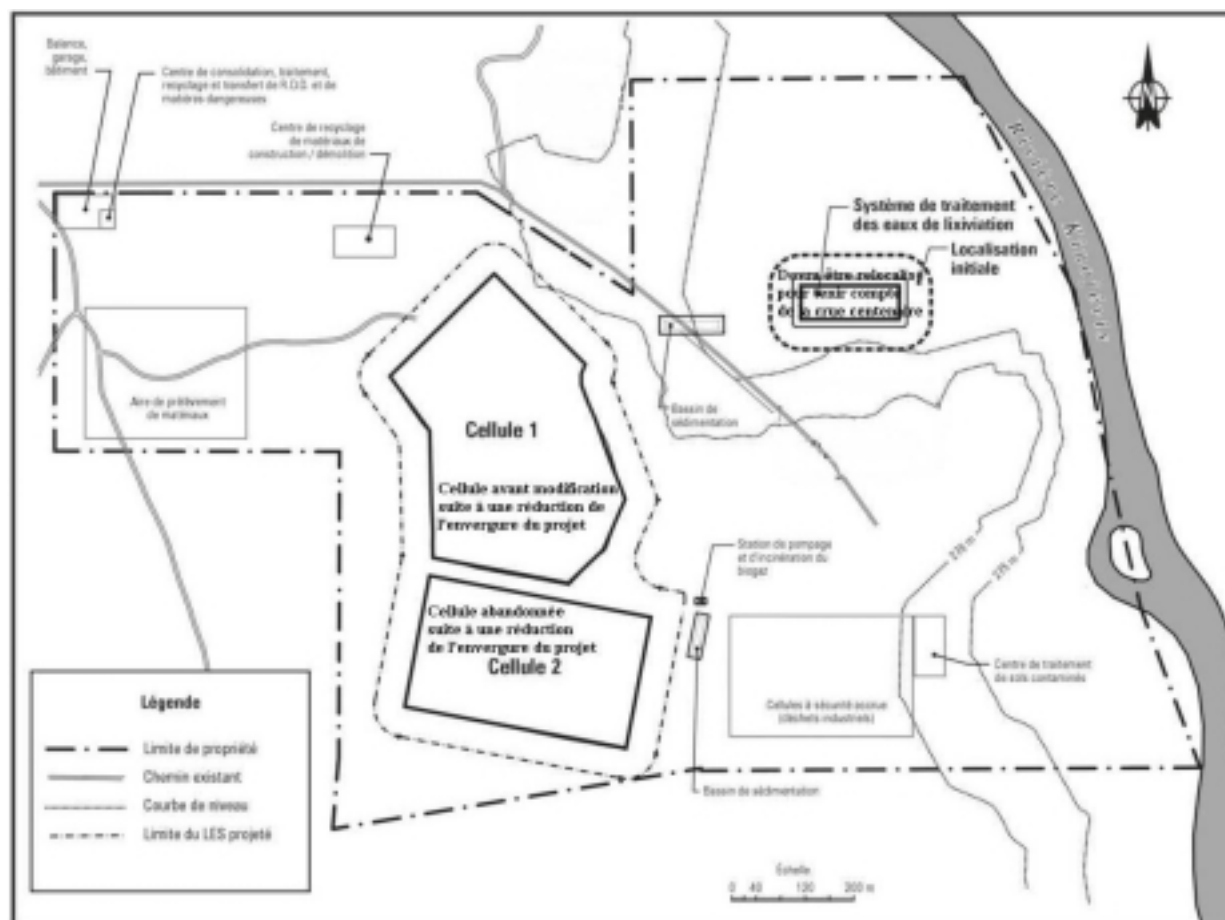
Figure 5 : Les aménagements originellement prévus pour le LES et les composantes connexes