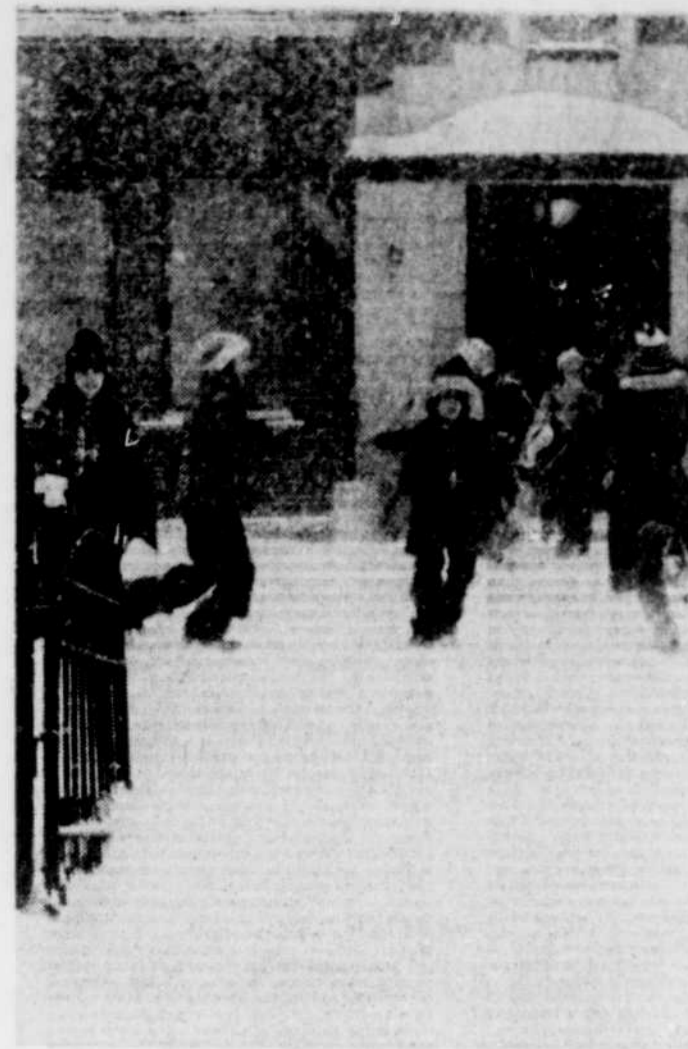
Le Soleil, André Belle-Mare

"Cette obligation envers les anglophones n'empêchera sûrement pas l'accomplissement du travail interne dans la langue des Tremblay, Jean-Noël ou Michel, au choix du fonctionnaire. (Suite à la page 2, 2e col.)