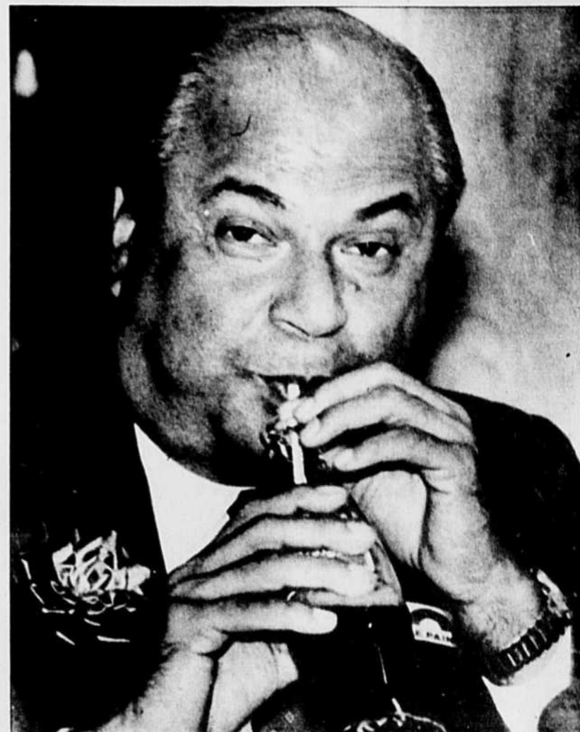
Louis Dejoie, l'un des chefs de l'opposition haïtienne, boit son Coke, hier, au cour d'un séjour-éclair à Montréal. Informations, page A-10.