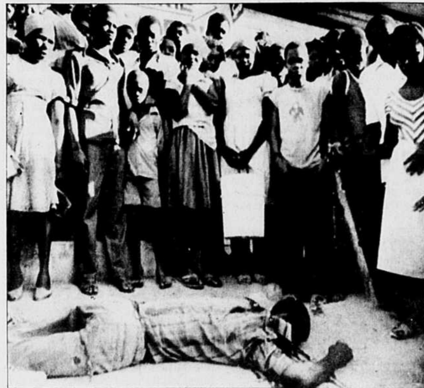
Inquiets et consternés, des Haïtiens regardent le corps d'un compatriote tué à coups de machette, à Port-au-Prince.