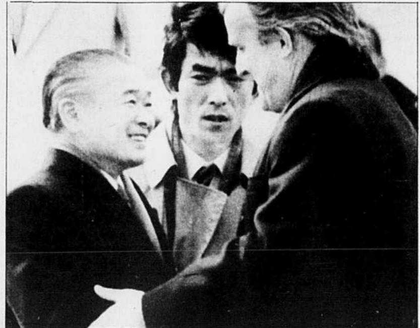
Le premier ministre Brian Mulroney accueille son homologue japonais Noboru Takeshita à son arrivée à Toronto où il passera deux jours.