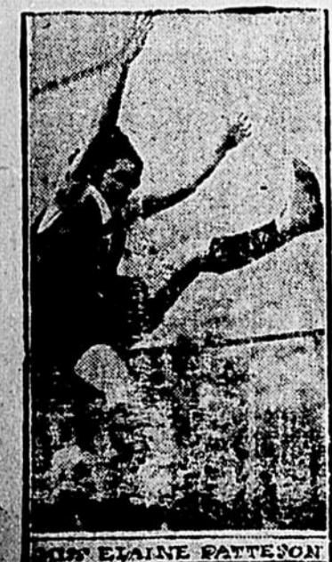
Mlle Elaine Patteson, championne du saut en hauteur des E.U. au Canada, lors d'un tournoi des 15 mai à Toronto.