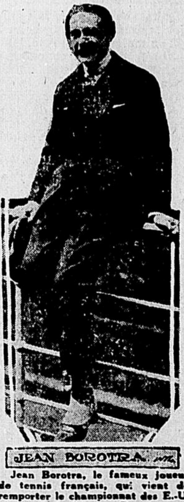
Jean Borotra, le fameux joueur de tennis français, qui vient de remporter le championnat des E.-U. au tennis intérieur. Borotra est actuellement en route vers son pays où il prendra la direction de l'équipe française pour le championnat international de la coupe Davis.

Le voyage transcontinental que l'Université de Montréal organise en ce moment avec le concours du Pacifique Canadien, présente un intérêt qui va grandissant à mesure qu'on s'approche des vacances d'été. On en parle dans tous milieux, et nombre de gens qui jusqu'ici, avaient l'habitude d'aller séjourner dans quelque village dépendance ou de voyager de l'autre côté de la frontière, se demandent non sans raison, s'ils ne feraient pas mieux de profiter cette année de l'occasion magnifique qui leur est offerte de visiter leur propre pays. L'attrait d'un voyage fait dans de telles conditions, avec tout le luxe que peut offrir un train moderne et en compagnie de personnes de même mentalité, est considérable; mais lorsqu'à cela s'ajoute le prestige d'une institution telle que l'Université de Montréal, il est difficile de ne pas s'intéresser au projet.