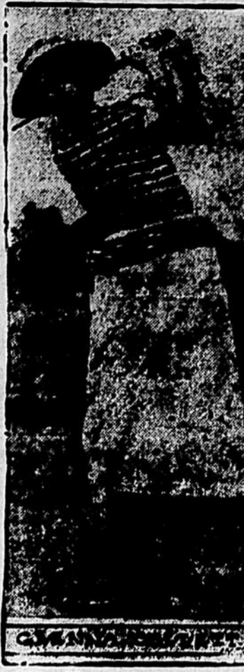
Mlle Glenna Collett qui vient de se classer championne d'un tournoi de golf ouvert pour les championnats des dames. Ce tournoi aura lieu à Troon, Angleterre, le 18 mai.