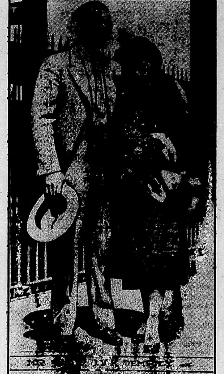
Jack Dempsey, le champion poids lourd du monde, a répondu aux journalistes qu'il était trop occupé pour leur parler, alors qu'il attendait son épouse Estelle Taylor dans les bureaux de la Commission de boxe de New-York, pour une entrevue avec les Solons.