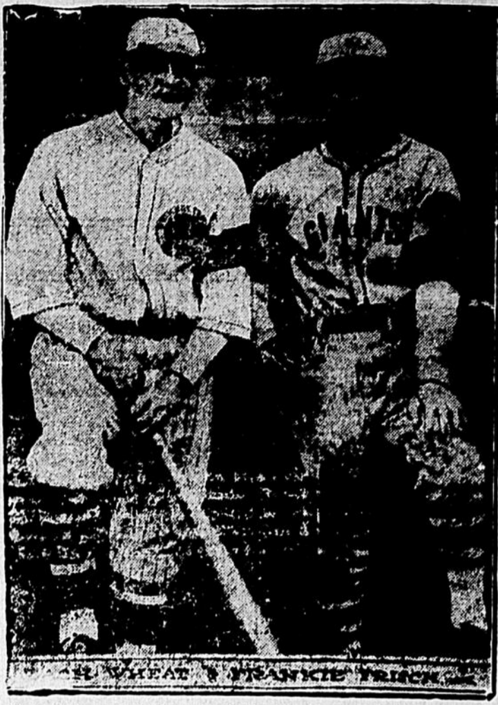
Zach Wheat, capitaine de l'équipe Brooklyn de la Ligue Nationale, et Frankie Frisch, capitaine des New-York Giants, que l'on voit ici avec des brosseurs en signe de deuil pour Charles H. Ebbots, du club Brooklyn, dédicé à la suite d'une syncope de coeur.