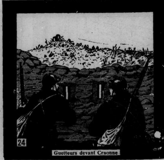
Guetteurs devant Craonne