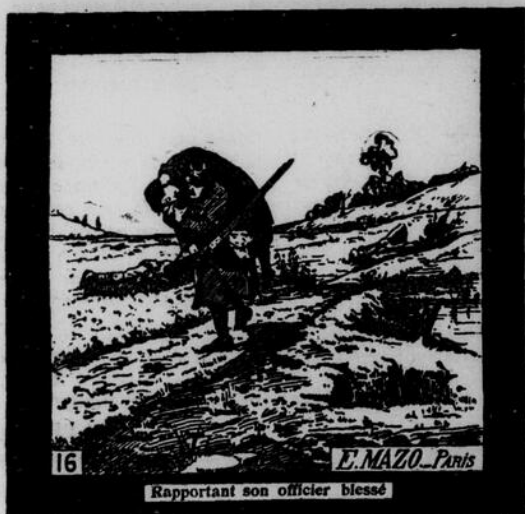
Rapportant son officier blessé