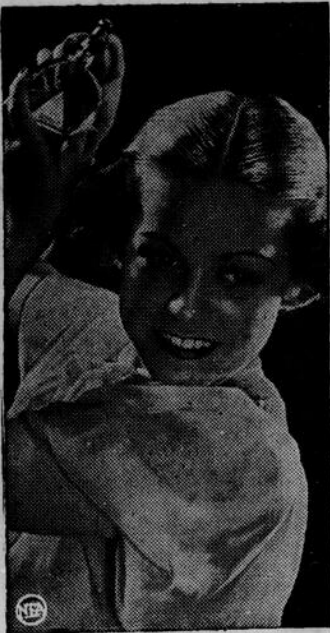
• La brillantine appliquée avec un vaporisateur donne au cheveu sec de l'éclat et l'empêche de sécher aux rayons du soleil.

Il faut, pour commencer, traiter chaque soir le cuir chevelu. Frottez-le avec une lotion antiseptique, puis, après un massage léger, vous le brossez vigoureusement. Versez un peu de lotion dans un vase, vous y trempez un linge assez grand en coton. Après avoir séparé vos cheveux en plusieurs tresses, vous appliquez le coton sur le cuir chevelu; ensuite avec le bout des doigts, vous le frottez jusqu'à ce que la lotion ait pénétré à l'intérieur. Ce massage va détacher les pellicules de sorte que vous n'aurez aucun trouble à les enlever avec la brosse quand le cheveu sera sec.