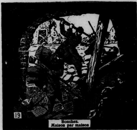
Bouchez. Maison par maison