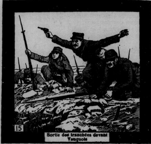
Sortie des tranchées devant Vanquois