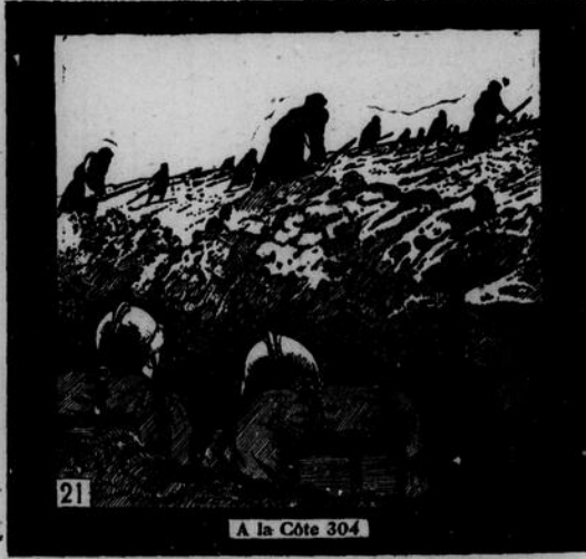
A la Côte 304