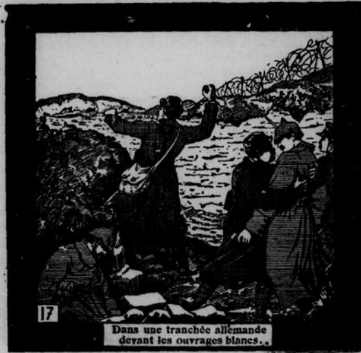
Dans une tranchée allemande devant les ouvrages blancs...