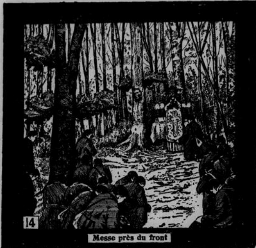
Messe près du front