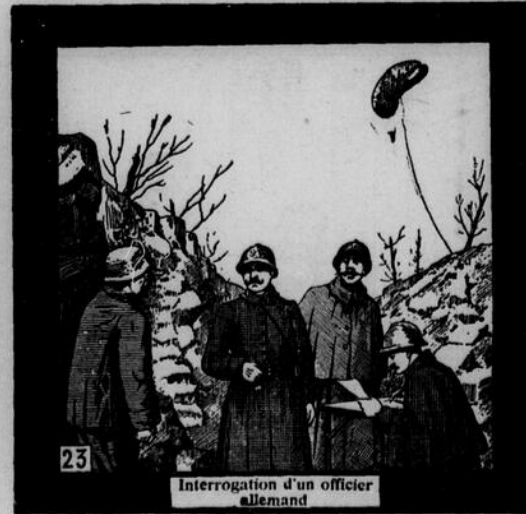
Interrogation d'un officier allemand