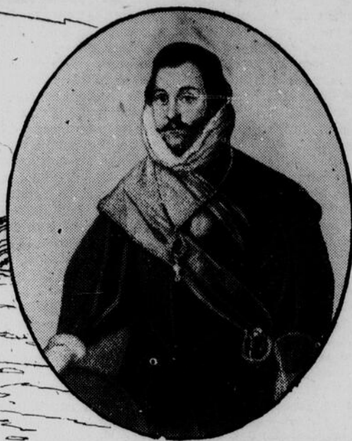
Lorsque le CERF D'OR a ancré dans la baie, les Indiens ont envoyé un des leurs en canot pour apaiser la présumée colère de leurs visiteurs.... Au-dessus, Sir Francis Drake, par un contemporain.

PAR le fait qu'un commis de magasin à rayons a dû arrêter pour réparer un pneu sur un côteau rocheux près de la baie San-Francisco et qu'après avoir fait son travail il s'est amusé à jeter des roches en bas de cette côte, l'histoire de la Californie s'est enrichie d'une pièce d'une grande importance perdue depuis longtemps et qui a valu à ce commis une récompense de $3500.