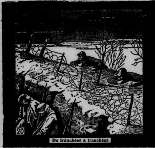
De tranchées à tranchées