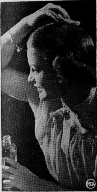
• L'emploi d'une lotion antiseptique élimine les pellicules et autres maladies du cuir chevelu et le tonifie.

Appliquez chaque matin un peu de brillantine quand vous peignez vos cheveux. Employez un vaporisateur que vous tien-