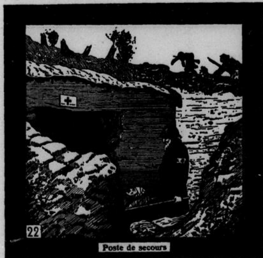
Poste de secours