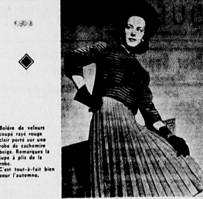
Boléro de velours coupé rayé rouge clair porté sur une robe de cachemire beige. Remarque la jupe à plis de la robe. C'est tout-à-fait bien pour l'automne.

—Vous êtes descendue bien bas, remarquai-je, je ne vous croyais pas capable de vous livrer à d'aussi tristes besognes. —Nous avions besoin d'argent, dit-elle, rigide. Il avait tout dépensé et