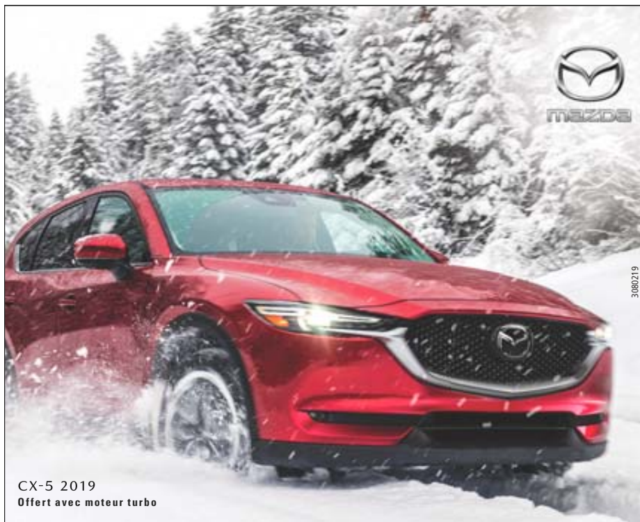
CX-5 2019 Offert avec moteur turbo