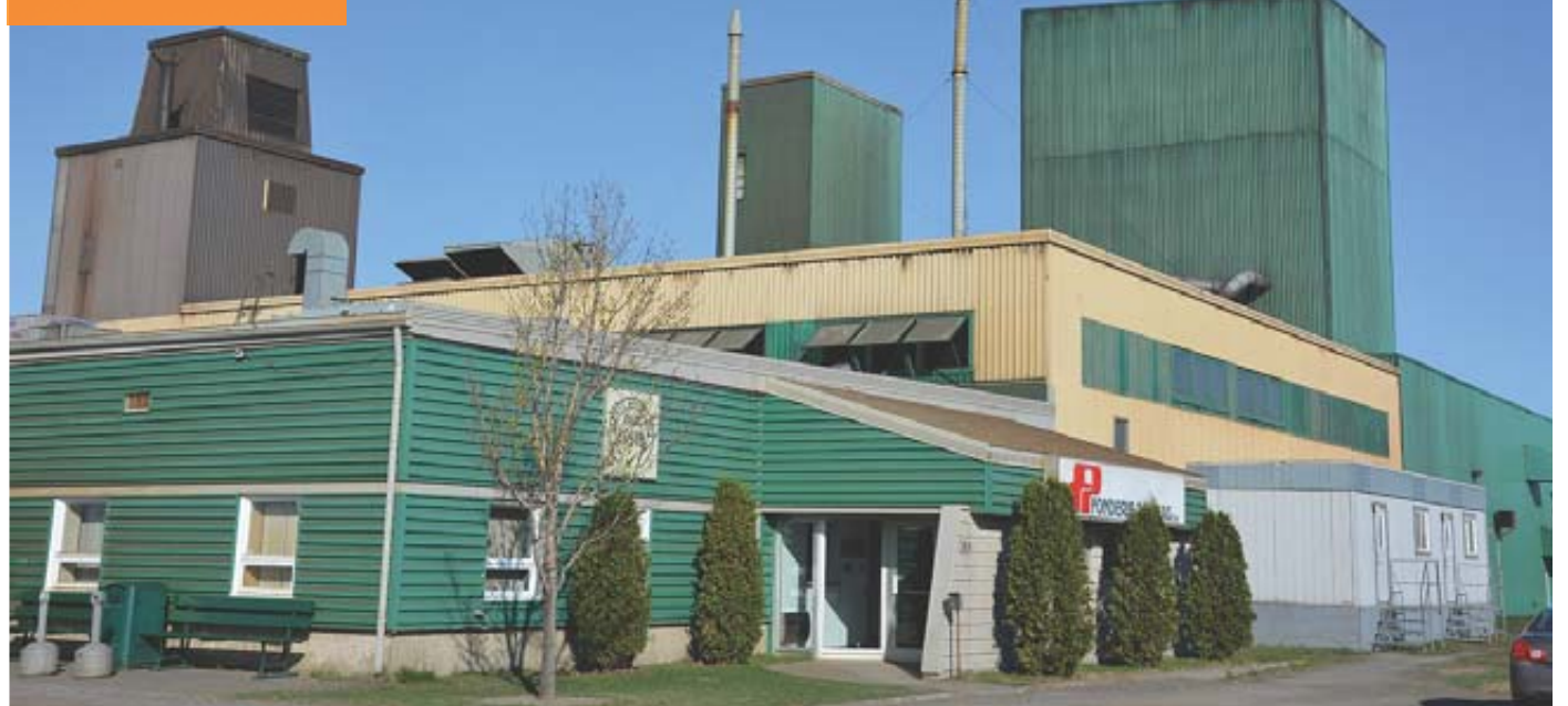
La Fonderie Poitras à L'Islet.