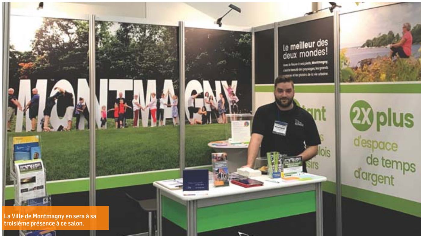
La Ville de Montmagny en sera à sa troisième présence à ce salon.

Montmagny figure toujours au palmarès des meilleurs