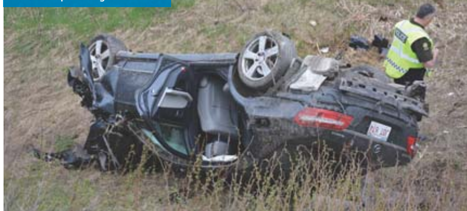
Cet accident s'est produit en mai dernier à Cap-Saint-Ignace.

grande majorité des collisions mortelles en 2018 est survenue le jour. Près du deux tiers des collisions mortelles surviennent entre 8 h et 20 h, le vendredi est la journée de la semaine où il y a eu le plus de collisions mortelles. Ces statistiques démontrent l'importance de demeurer vigilant, et ce, en tout temps.