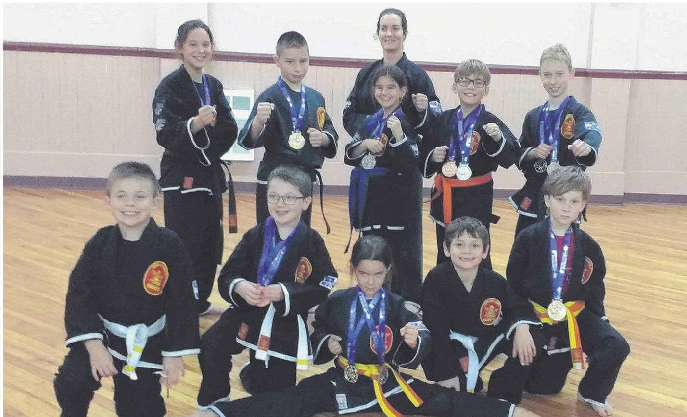
Les élèves de l'école Kenpo se sont illustrés sur la scène provinciale.