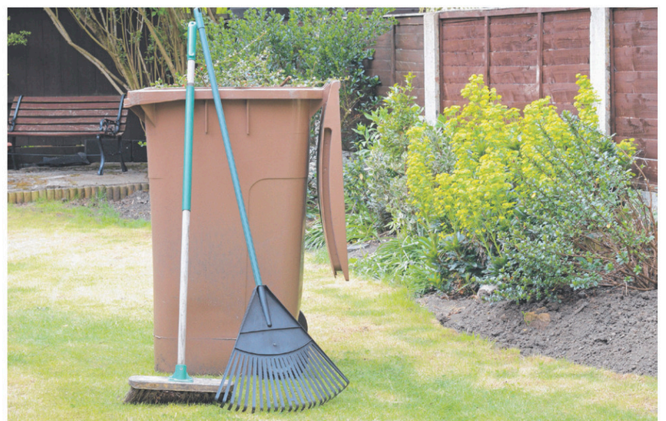
Des résidents de Saint-Cyprien-de-Napierville pourraient faire l'objet d'un projet-pilote visant à implanter le bac brun afin de recueillir les résidus alimentaires.

Si le PGMR est accepté, Saint-Cyprien devra lancer un appel d'offres pour la collecte et aussi trouver un endroit où disposer de cette matière organique.