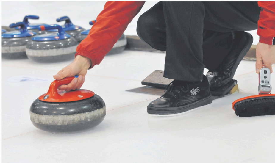
Cinq équipes de curling se disputeront les honneurs de la finale régionale des Jeux du Québec au Club de Lacolle.

Les jeunes joueurs sont âgés de 12 à 15 ans. Les spectateurs sont les bienvenus afin d'encourager les équipes. Les premières parties débiteront le 14 janvier, à 9 h.