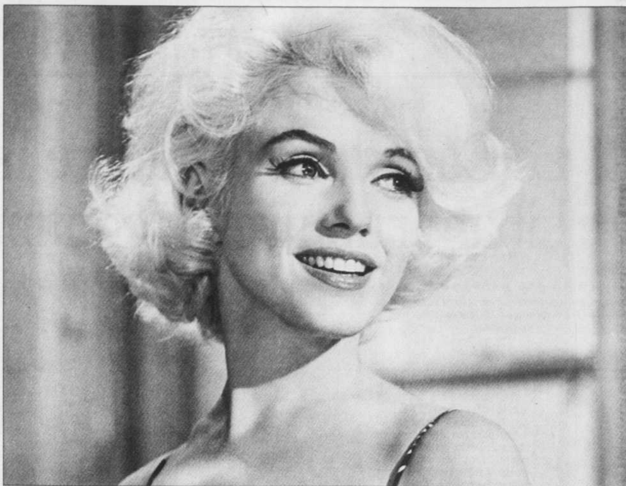
La montée de Marilyn Monroe fut l'une des plus fulgurantes dans toute l'histoire du cinéma.

"La mort tragique de Marilyn, dit-il, devrait servir de terrible leçon à tous ceux dont la principale occupation est d'épier et de torturer les vedettes de cinéma."