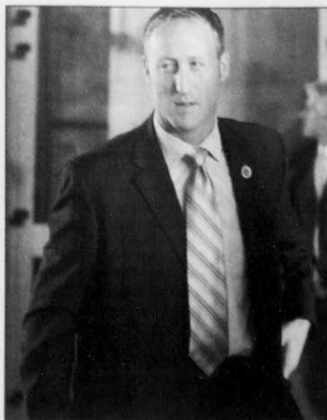
Peter Mackay, le ministre fédéral des Affaires étrangères, lors de la rencontre de Rome sur la crise libanaise.