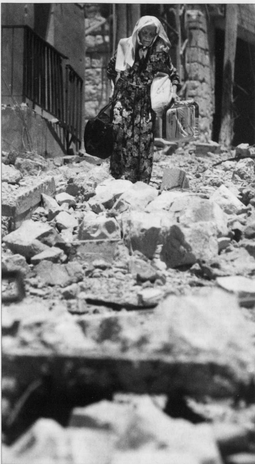
Un éclat de couleur dans la grisaille des décombres de Bent Jbaïl, au sud du Liban. Pour Ottawa, l'analyse du conflit actuel est claire: Israël a le droit de se défendre contre un groupe terroriste qualifié de «cancer».

La position du Canada a commencé à changer bien avant l'arrivée des conservateurs au pouvoir à Ottawa. Depuis 2003, le Canada a commencé à modifier ses votes à l'ONU sur toutes les résolutions touchant en particulier le conflit israélo-palestinien. Il a voté non à certaines résolutions condamnant Israël, alors qu'il s'abstenait auparavant. Et sur d'autres résolutions portant sur le processus de