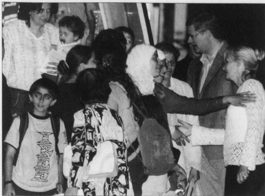
Stephen Harper en compagnie d'évacués libanais lors de leur retour au Canada, le 21 juillet. Le premier ministre avait autorisé l'utilisation d'un avion militaire canadien pour permettre l'évacuation de Canadiens d'origine libanaise.

Bien qu'il faille remonter relativement loin pour