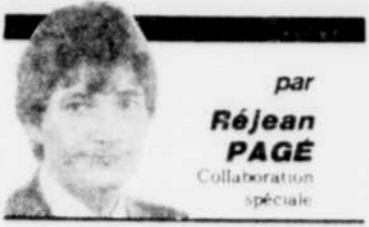
par Réjean PAGE Collaborateur spécial

◆ Selon une étude réalisée par la revue Videocom en septembre, le nombre de clubs vidéo aurait augmenté de 50 pour 100 par rapport à l'an dernier. La concurrence entre les clubs devient donc très forte et seuls ceux dotés d'une structure pouvant répondre adéquatement à la demande survivront.