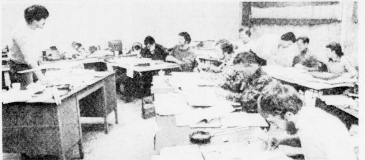
Ce groupe de chômeurs suivent une longue série de cours de formation qui leur donnera peut-être accès à un emploi stable.

Ce suspense, fermeture-exploitation, fut habilement entretenu