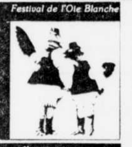
Festival de l'Oie Blanche

MARCHÉ AUX PUCES D'ÉQUIPEMENT SPORTIF. organisée par la coopérative de consommation de Charlebourg. Dim. 10h à 14h, école des Loutres, 7240 des Loutres, Charlebourg. LE CENTRE HOSPITALIER