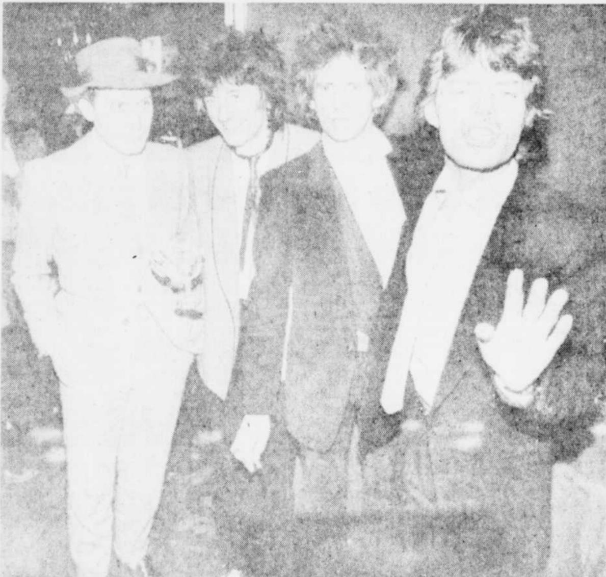
Les Rolling Stones lors du lancement du film "Let's spend the night together".

La récente annonce de l'enregistrement du premier microsillon solo de Mick Jagger en a surpris plus d'un et a du même coup relancé les spéculations quant à l'avenir des Rolling Stones.