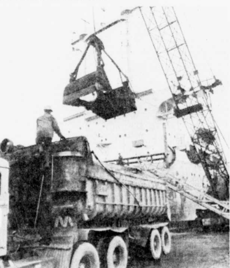
L'arrivage du cuivre chilien au port de Mont-Louis, sur la rive nord de la Gaspésie, constitue un apport important pour le maintien des travaux à l'usine de smeltage de Murdochville.