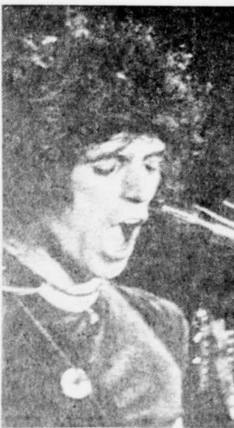
Keith Richards lors d'un concert à Oshawa.

◆ En 1975, Mick Jagger déclarait dans une entrevue "Je me vois mal chanter Satisfaction lorsque j'aurai 40 ans". Aujourd'hui ces "éternels adolescents", ces "déliquants", ces "révoltés" ont tous passé le cap de la quarantaine: Mick Jagger a 41 ans, Keith Richards en a 40, Charlie Watts en a 43, et Bill Wyman est l'aîné avec 48 ans.