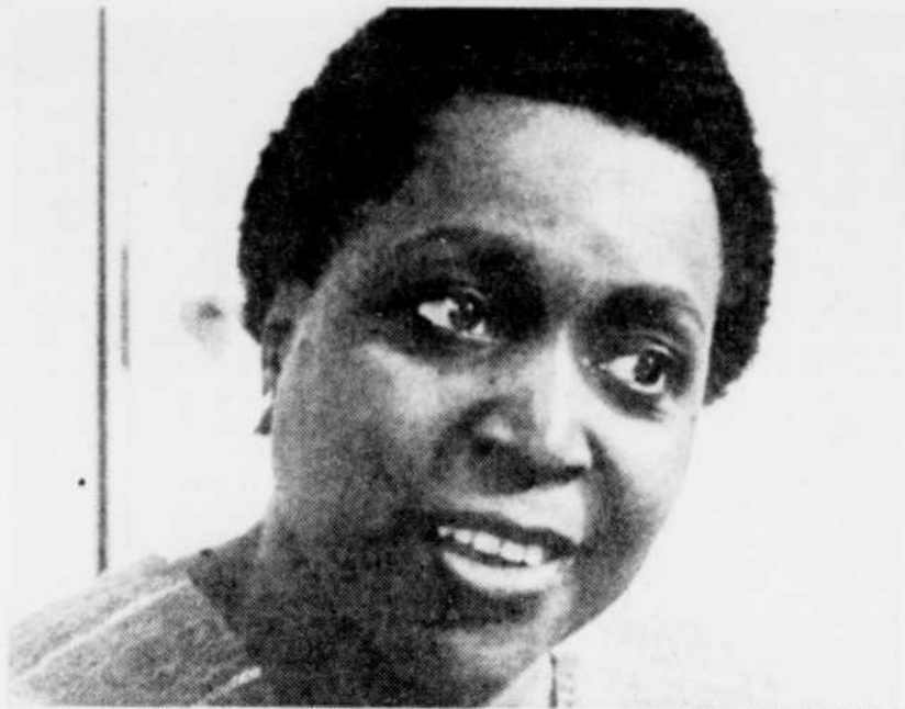
"Quand on a grandi à New York, on peut s'adapter à n'importe quel milieu."

Son cheminement, peu banal, ressemble pourtant au fond à celui de beaucoup de femmes. Une enfance à New York, un mariage précoce, plusieurs années de vie bohème et de voya-