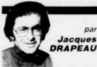
par Jacques DRAPEAU

La nouvelle présidente de la Fédération de l'âge d'or du Québec, première femme d'ailleurs à présider les destinées de l'organisme, annonce ses couleurs avec des mots à peine voilés. Ses 29 années passées dans le monde de l'enseignement, au beau milieu d'une vie particulièrement bien étoffée de riches expériences, lui ont conféré toute l'assurance nécessaire pour relever le défi.