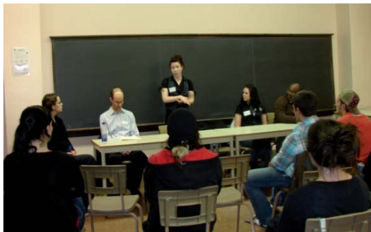
Atelier des professionnels de la santé : pharmaciens, physiothérapeute, nutritionniste, kinésiologue.

Ils ont été unanimes quant à la réussite de cette première édition de l'activité Carrières qualifiant les échanges de riches et généreux. Aussi, des panellistes ont demandé d'y être invités à nouveau tandis que plusieurs étudiants ont trouvé des réponses à leurs questions. Félicitations au comité organisateur !