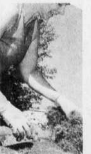
Le jardinage contribue-t-il à la bonne forme physique?

Les déplacements utilitaires sont effectivement deux fois plus populaires chez les résidents de grands centres, qui vont pédaler ou marcher pour se rendre au travail ou à l'épicerie un peu moins d'une fois sur trois, contre environ une fois sur sept pour les habitants de quartiers