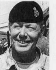
le brigadier-général Jonathan Vance

Depuis le début de la mission canadienne en Afghanistan, 127 militaires ont perdu la vie, dont sept depuis le début du mois de juillet. Hier, deux