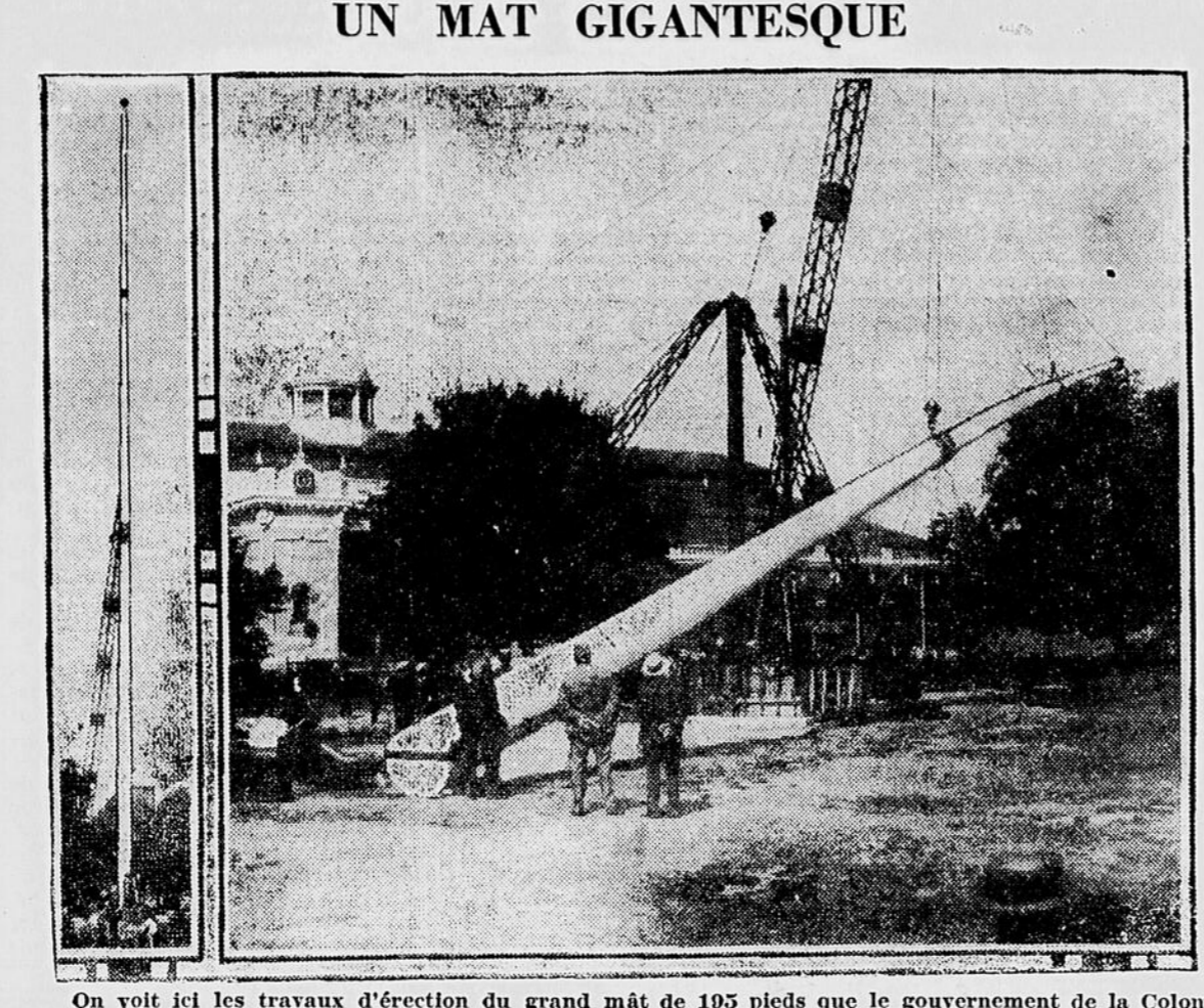
On voit ici les travaux d'érection du grand mâât de 195 pieds que le gouvernement de la Colombie Anglaise vient d'offrir à l'Exposition de Toronto. Ce mâât est érigé au sud du pavillon Horticole. C'est probablement le plus haut mâât du monde. Il fut transporté à Toronto, par mer, via le Canal de Panama. A gauche on voit le mâât, tel qu'il apparaît érigé. Il fallut pour l'ériger une grue de 77 pieds de long.