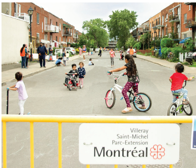
Rue ludique sur la rue Birnam, dans le quartier Parc-Extension à Montréal