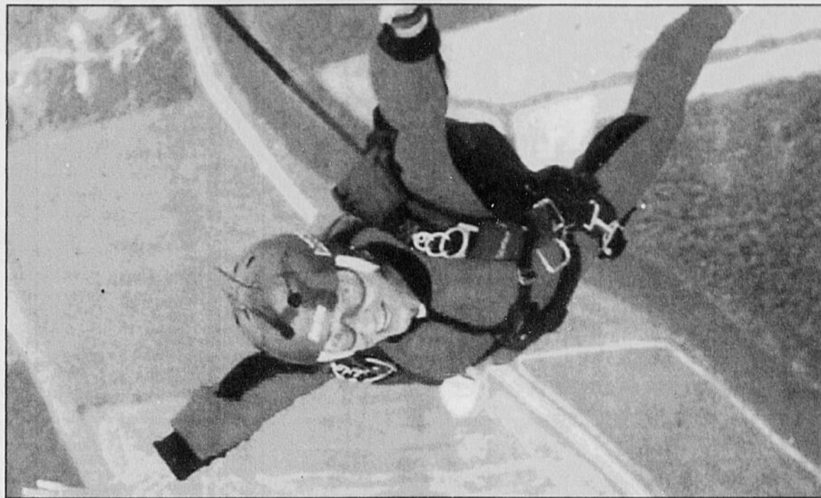
Des membres du Club de parachutisme de Victoriaville animeront l'ouverture de la 27e édition de la classique PIF.

La Club de parachutisme de Victoriaville existe