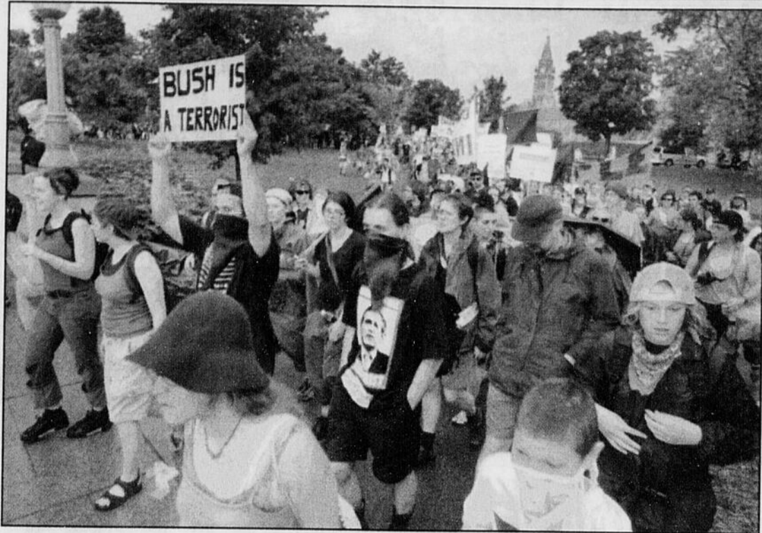
Ottawa a connu une autre journée de manifestations anti-mondialisation hier. Le nombre de manifestants a été estimé à 5000 et il n'y a pas eu de grabuge.

«Manifester, c'est presque la seule chose qui me reste