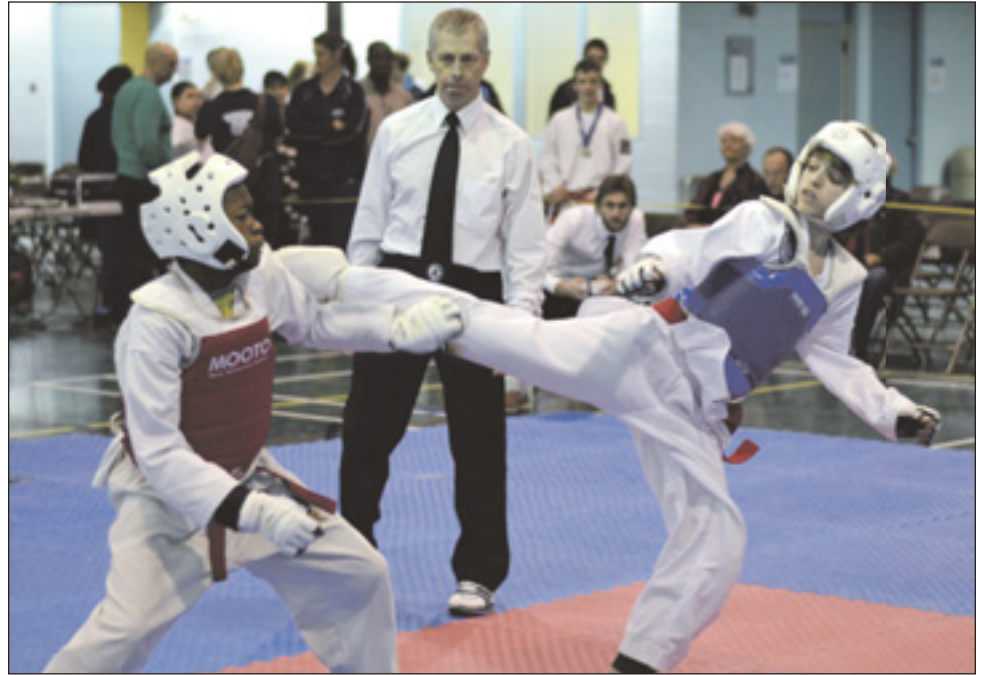
Le Club de Taekwondo de Cap-Rouge et Saint-Augustin invite les membres de votre famille à découvrir cette discipline olympique.

Visitez leur site Web pour y trouver le formulaire d'inscription, l'horaire, l'information sur les tarifs et sur leur politique familiale. Il est également possible de s'inscrire via la programmation automne/hiver des villes de Québec et de Saint-Augustin. Inscription : en tout temps, en ligne, à l'adresse suivante : www.tkd-crsa.ca/web/Inscription_et_cours.html ■