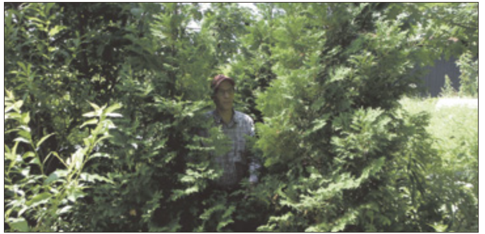
Une bande riveraine au lac, bien végétalisée en 2010.

Le lac Saint-Augustin est un milieu naturel qui confère un caractère unique et une valeur ajoutée aux terrains riverains. En ce sens, le propriétaire d'un terrain riverain a une responsabilité envers le lac, car en protégeant la rive, il protège le lac et son investissement.