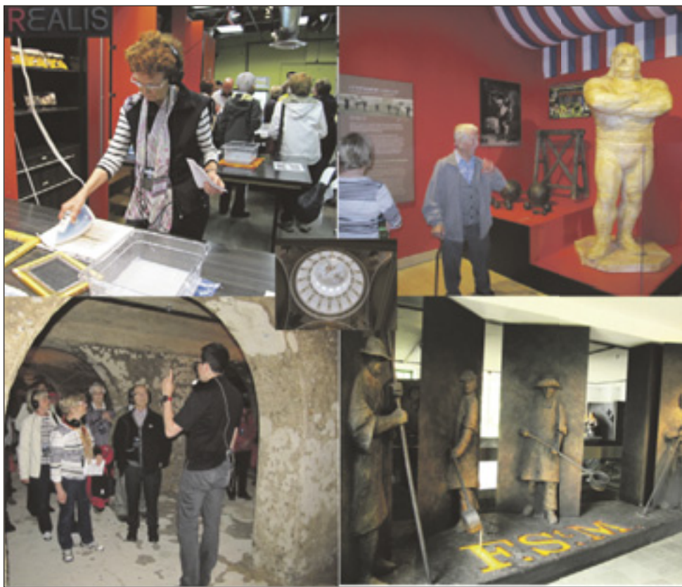
Une belle sortie pour une cinquantaine de personnes du Club FADOQ la Moisson d'or récemment. Un retour dans l'histoire de Trois-Rivières.

des Forges du Saint-Maurice qui abrite les vestiges de la première entreprise sidérurgique au Canada. En après-midi, un arrêt au Musée québécois de la culture populaire pour admirer les hommes forts, puis un petit tour en prison. Pour terminer la journée, un arrêt au Musée des Ursulines pour visiter la chapelle et son dôme symbole du Vieux Trois-Rivières. Une journée remplie de beaux témoignages de l'histoire. ■