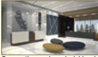
Perspective couleur du lobby du nouvel hôtel Marriott Courtyard.

Nourcy Comptoir Traiteur vient d'annoncer que l'entreprise assurera tout le volet restauration et bar du nouvel hôtel Marriott Courtyard de Québec qui a récemment ouvert ses portes à la fin juillet. En plus d'être entièrement responsable du nouveau restaurant nommé le Commissariat, situé au rez-de-chaussée de l'hôtel, l'équipe de Nourcy sera à la tête de la section-bar et des banquets pour le nouvel hôtel. Un défi de taille, mais qui promet ! Le Commissariat porte ce nom en raison de sa situation géographique, car il est carrément installé entre une caserne de pompier et un nouveau poste de police (devenant ainsi assurément l'endroit le plus « sécuritaire » en ville !) proposera une cuisine fine et délicate inspirée des quatre coins du monde, le tout à des prix abordables et dans une ambiance chaleureuse.