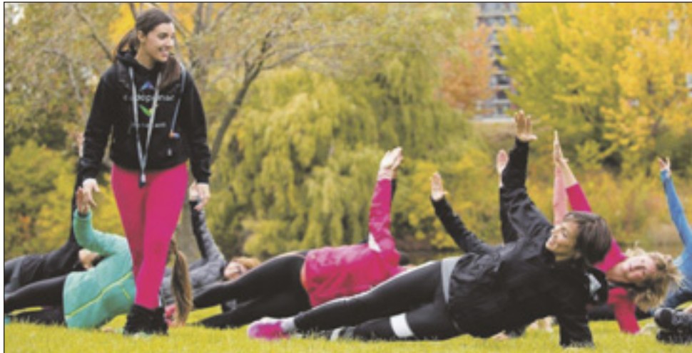
Le 10 septembre prochain, Cardio Plein Air St-Augustin offre quatre séances gratuites à 9 h (Cardio-BootCamp), 9 h 15 (Cardio-Musculation), 10 h 30 (Cardio-F.I.T) et 10 h 45 (Cardio-Jogging initiation) à l'éco-parc Riverain situé à l'extrémité Sud-Ouest du lac Saint-Augustin.

Cardio Plein Air dans les deux dernières années. Vous pouvez consulter l'horaire au www.cardiopleinair.ca pour connaître tous les cours offerts cet automne. ■