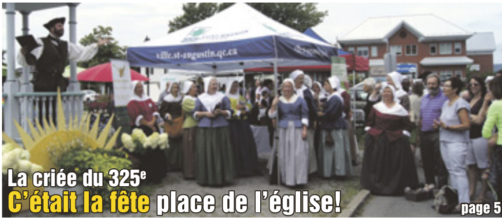
La criée du 325 e C'était la fête place de l'église! page 5