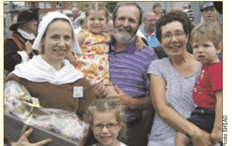
Un lot qui donne le sourire : produits de l'érable.

Cette activité annuelle a pour but de rappeler à notre mémoire le sens de la criée dans la vie collective d'autrefois. Les profits de cette criée iront au financement d'une plaque commémorative qui sera dévoilée le 30 octobre à l'occasion du 200 e anniversaire de l'ouverture de l'église actuelle, joyau du patrimoine. Cette journée marquera également la clôture des Fêtes du 325 e de Saint-Augustin-de-Desmaures. ■