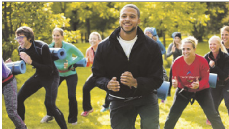
Il est également temps de vous inscrire pour la session d'automne qui se déroulera du 12 septembre au 18 décembre.