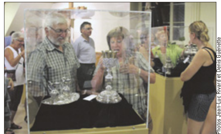
La très belle exposition « Les trésors du patrimoine religieux de l'église de Saint-Augustin », qui présente les plus belles pièces d'orfèvrerie de notre église.