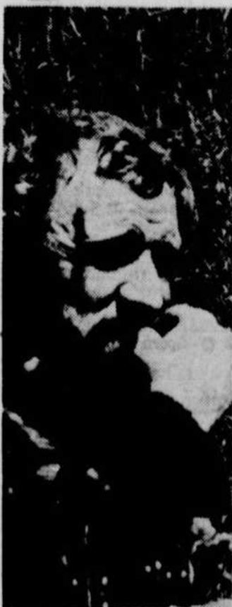
Aux Beaux Dimanches, une scène de "L'Oie des neiges" le 1er avril à 19h.30. CBVT.