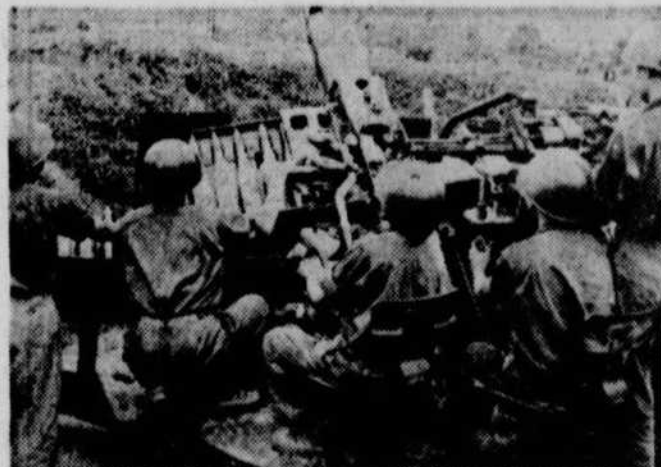
(Dossier Vietnam) Trente ans de guerre et une paix promise, racontés en 7 jours à la télévision communautaire de Québec.