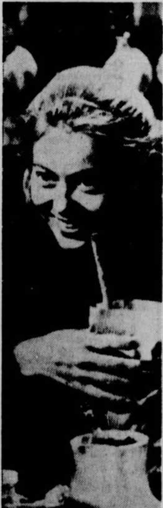
"L'Ole des neiges" une histoire touchante dans une réalisation de qualité.