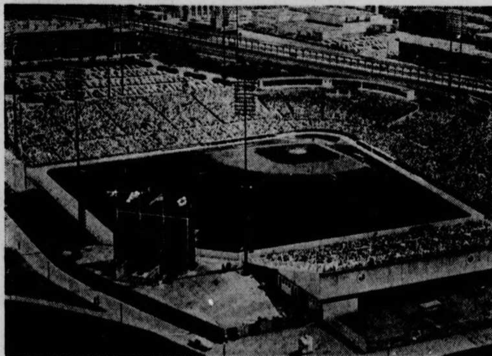
La t6l6vision de Radio-Canada diffusera en exclusivit6 21 parties de BASEBALL des Expos de Montr6al : 14 parties au parc Jarry 6 Montr6al et 7 parties dans les autres villes du circuit.