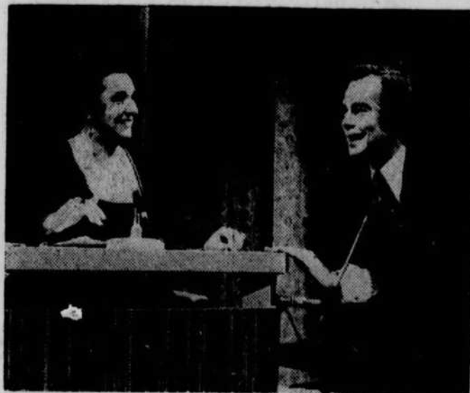
C'est vendredi le 11 mai que le "Gala des Prix Orange Citron" sera présenté à Appelez-moi Lise à 23 heures. CBVT.