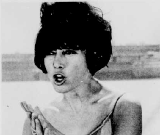
PAULINE JULIEN, à «Mon pays, mes chansons», samedi à 9 heures.