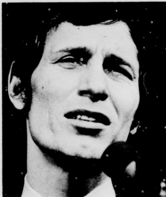
JEAN-PIERRE FERLAND, à la Boîte à chansons de «Jeunesse oblige», jeudi à 6 heures.