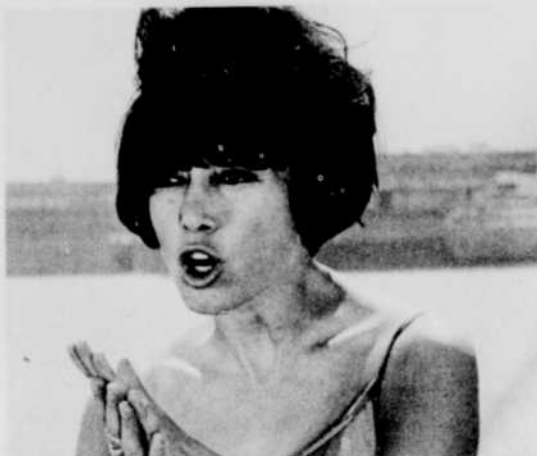
PAULINE JULIEN, à «Mon pays, mes chansons», samedi à 9 heures.