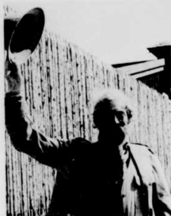
Ulysse, explorateur, de la série «Ulysse et Oscar», se promène à l'Expo d'où il salue ses amis tous les jours à 4 heures de l'après-midi.