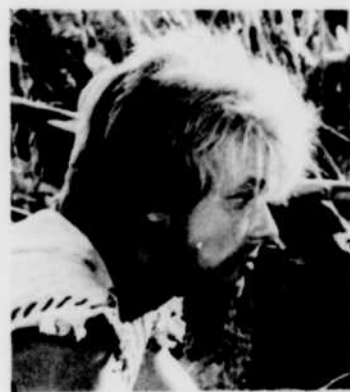
Exilé sur son île, «Robinson Crusoe» vit chaque semaine une aventure palpitante, le jeudi à 5 h 30.

Ici Radio-Canada Horaire des chaînes françaises de radio et de télévision de Radio-Canada Semaine du 29 juillet au 4 août 1967