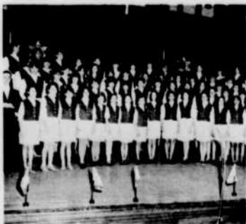
La chorale Beauséjour

Chorales acadiennes est réalisé à Moncton par Pierre Leblanc.