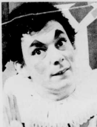
Monsieur Surprise accueille les jeunes à «La Boîte à Surprise», tous les jours à 4 h 30 de l'après-midi.