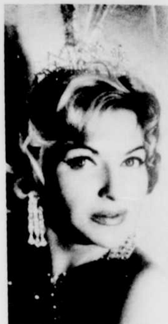
de la recherche dans les souvenirs.