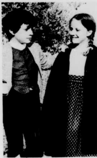
«L'Ane Culotte», cet animal étrange que deux braves enfants ont sauvé, vient lui aussi à la télévision de Radio-Canada, pour le plaisir des jeunes, le lundi après-midi à 5 h 30.