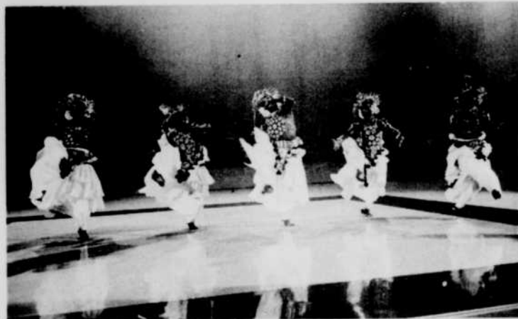
Les danseurs de Ceylan

Le Monde du spectacle présente à tous les jeudis, à la télévision, comme on le sait, des extraits de spectacles dignes d'intérêt qui ont été donnés dans le cadre du Festival mondial.