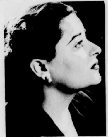
Joan Sutherland et Victoria de los Angeles, qu'on pourra entendre à l'émission radiophonique «Une loge à l'opéra», dimanche à midi.