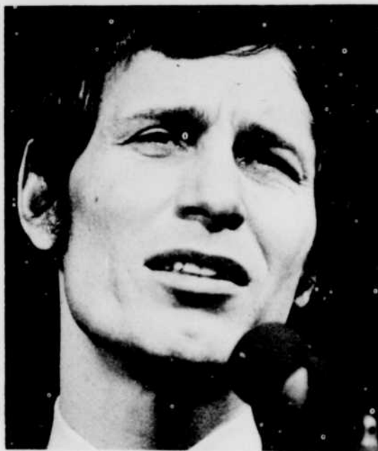
JEAN-PIERRE FERLAND, à la Boîte à chansons de «Jeunesse oblige», jeudi à 6 heures.