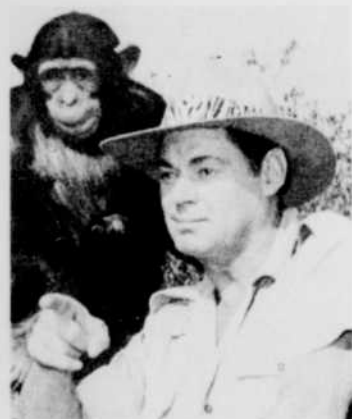
Le roi de la jungle indique à son célèbre chimpanzé Tamba une route à suivre pour sauver un bateau attaqué par des indigènes. «Le Roi de la jungle» revient tous les mercredis et vendredis à 5 heures.